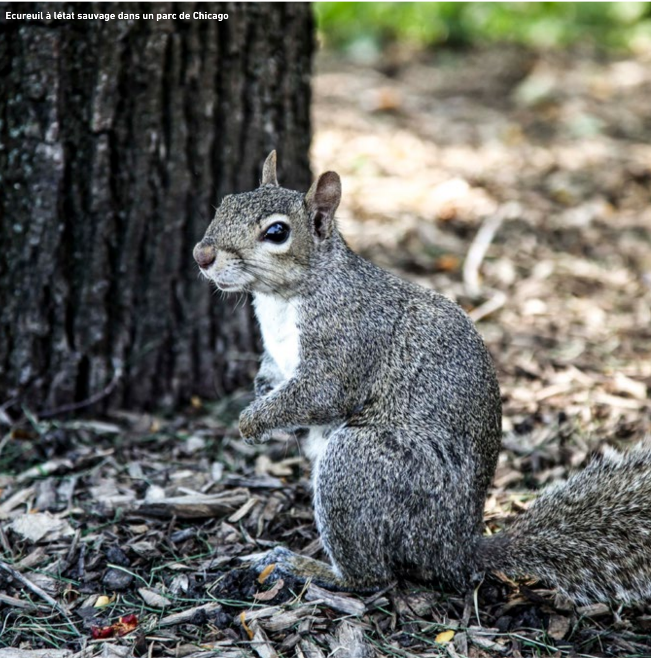
Ecureuil à l'état sauvage dans un parc de Chicago