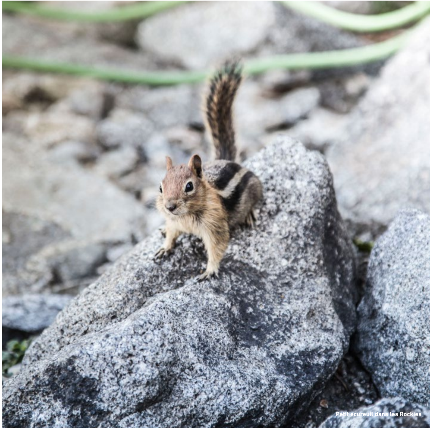
Petit ecureuil dans les Rockies