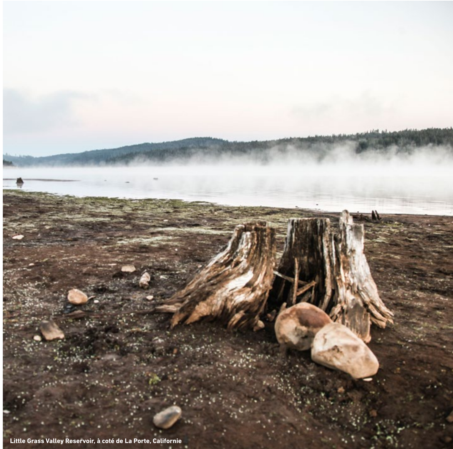
Little Grass Valley Reservoir, à côté de La Porte, Californie

“On peut braver les lois humaines , mais non résister aux lois naturelles .”