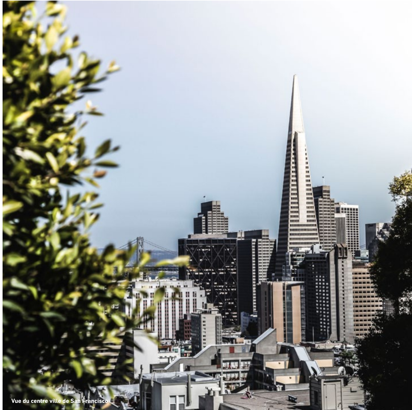
Vue du centre ville de San Francisco

Le plus beau métier d'homme est le métier d'unir les hommes.