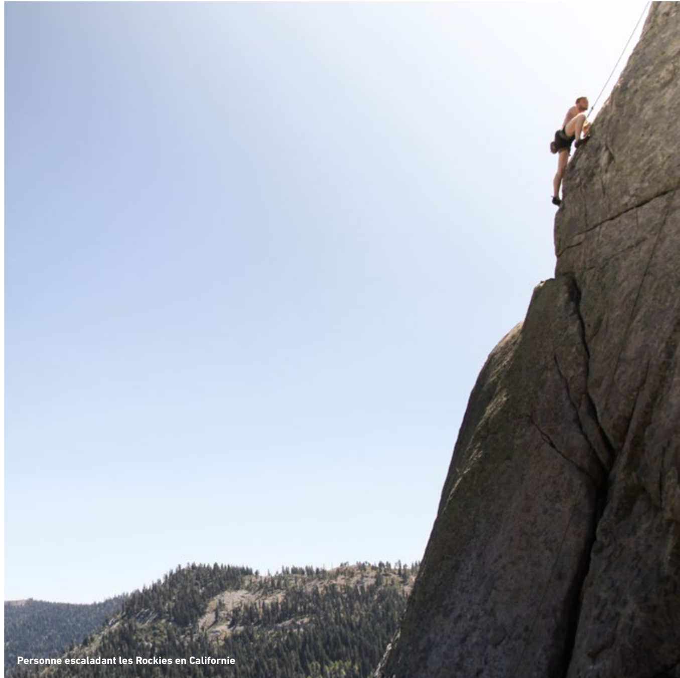
Personne escaladant les Rockies en Californie