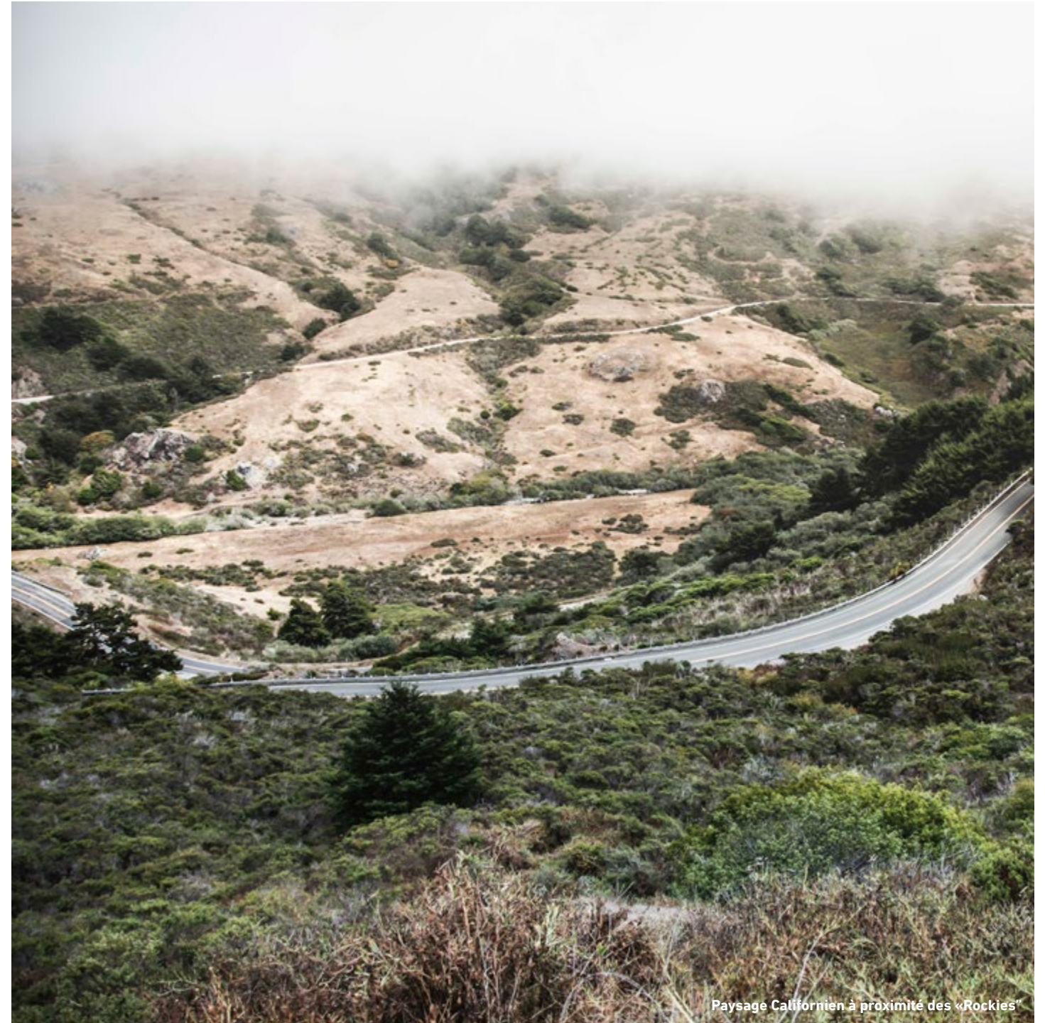
Paysage Californien à proximité des «Rockies»