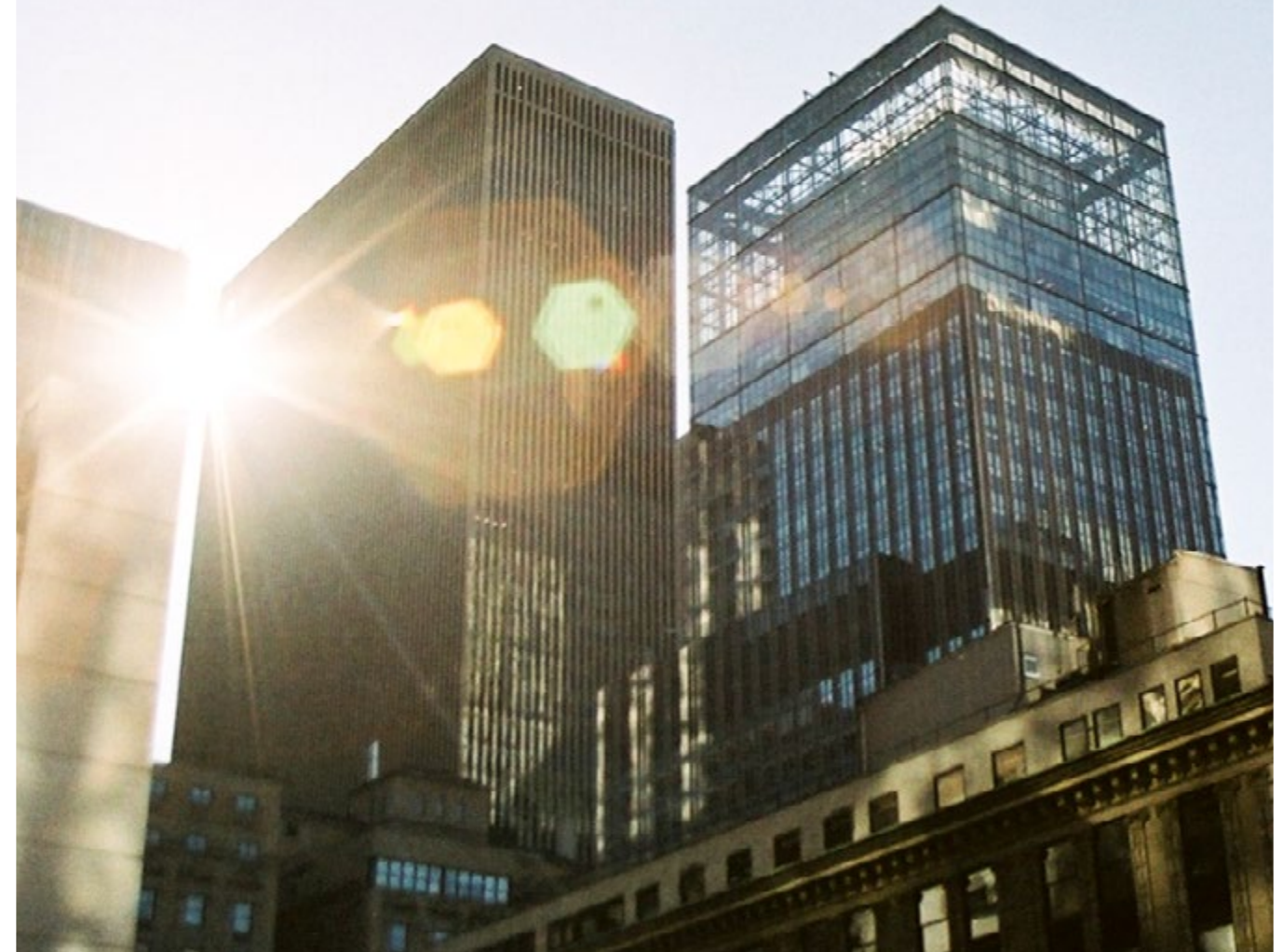
Vue d'un immeuble de Manhattan

New York est située sur la côte Est des Etats-Unis, la métropole s'ouvre sur l'Océan Atlantique. et se trouve à mi-distance entre Washington et Boston. Elle est le symbole par excellence des villes se construisant verticalement, étant la première du genre.