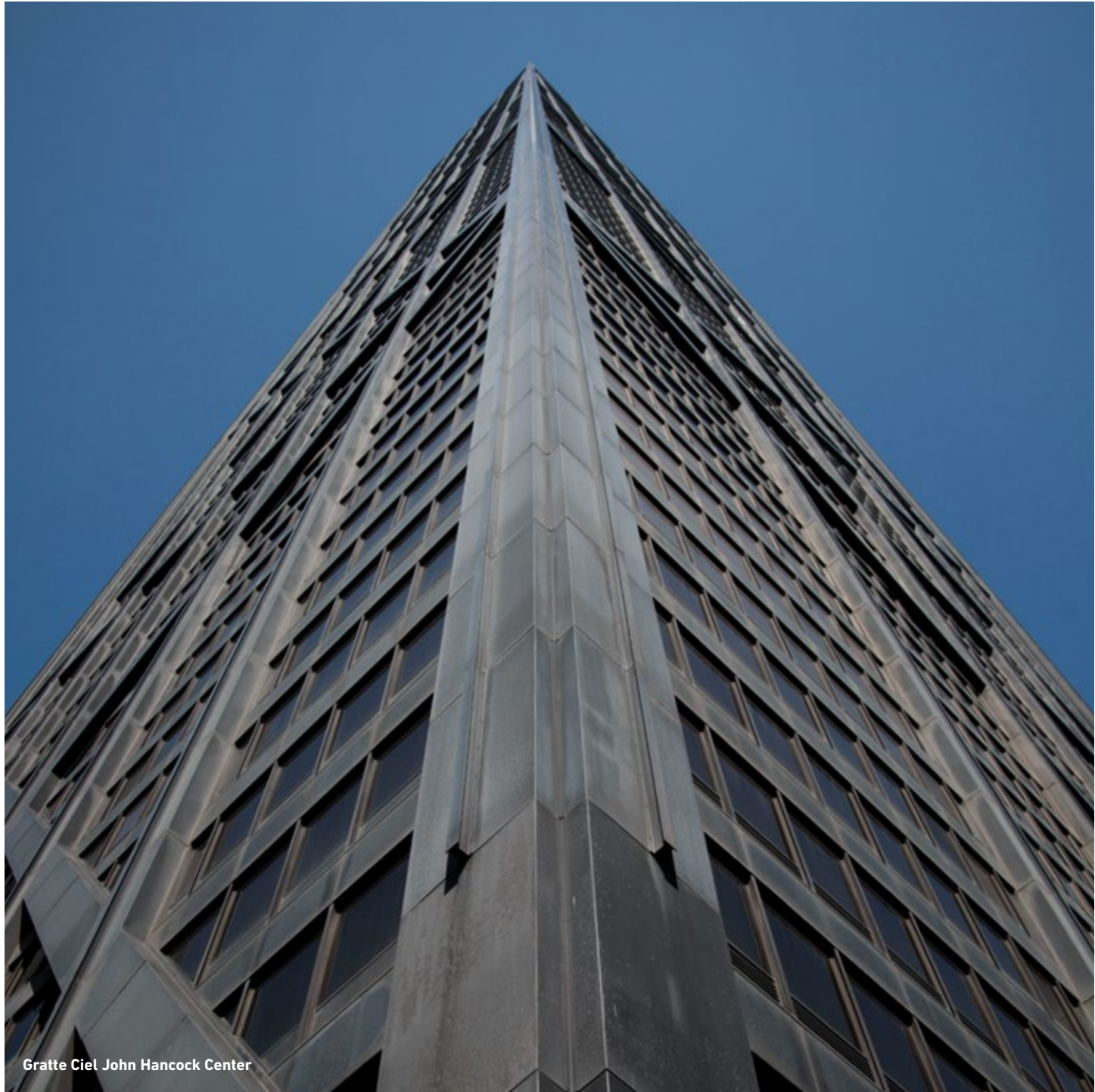
Gratte Ciel John Hancock Center