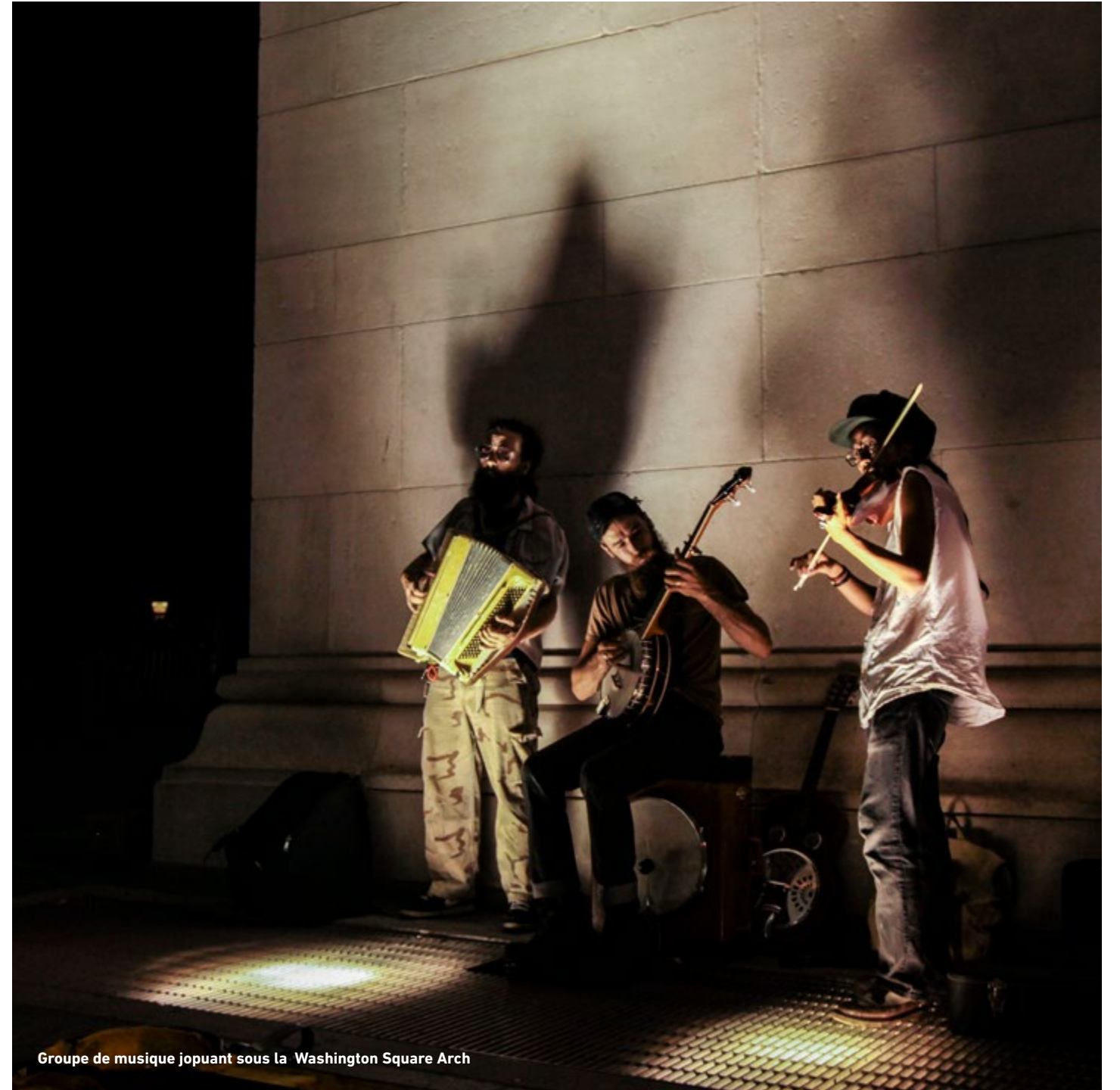
Groupe de musique jouant sous la Washington Square Arch