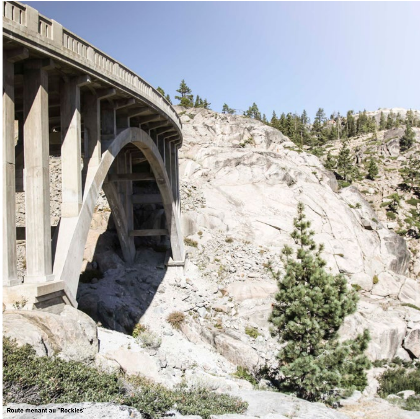
Route menant au "Rockies"