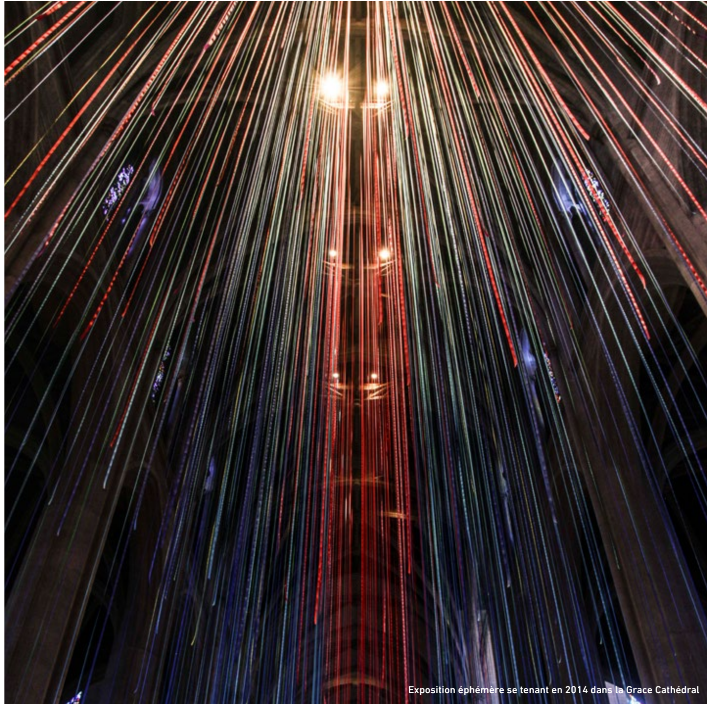
Exposition éphémère se tenant en 2014 dans la Grace Cathédral

“ Les seuls beaux yeux sont ceux qui vous regardent avec tendresse. ”