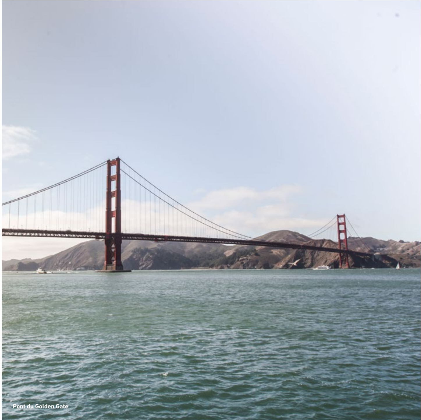
Pont du Golden Gate