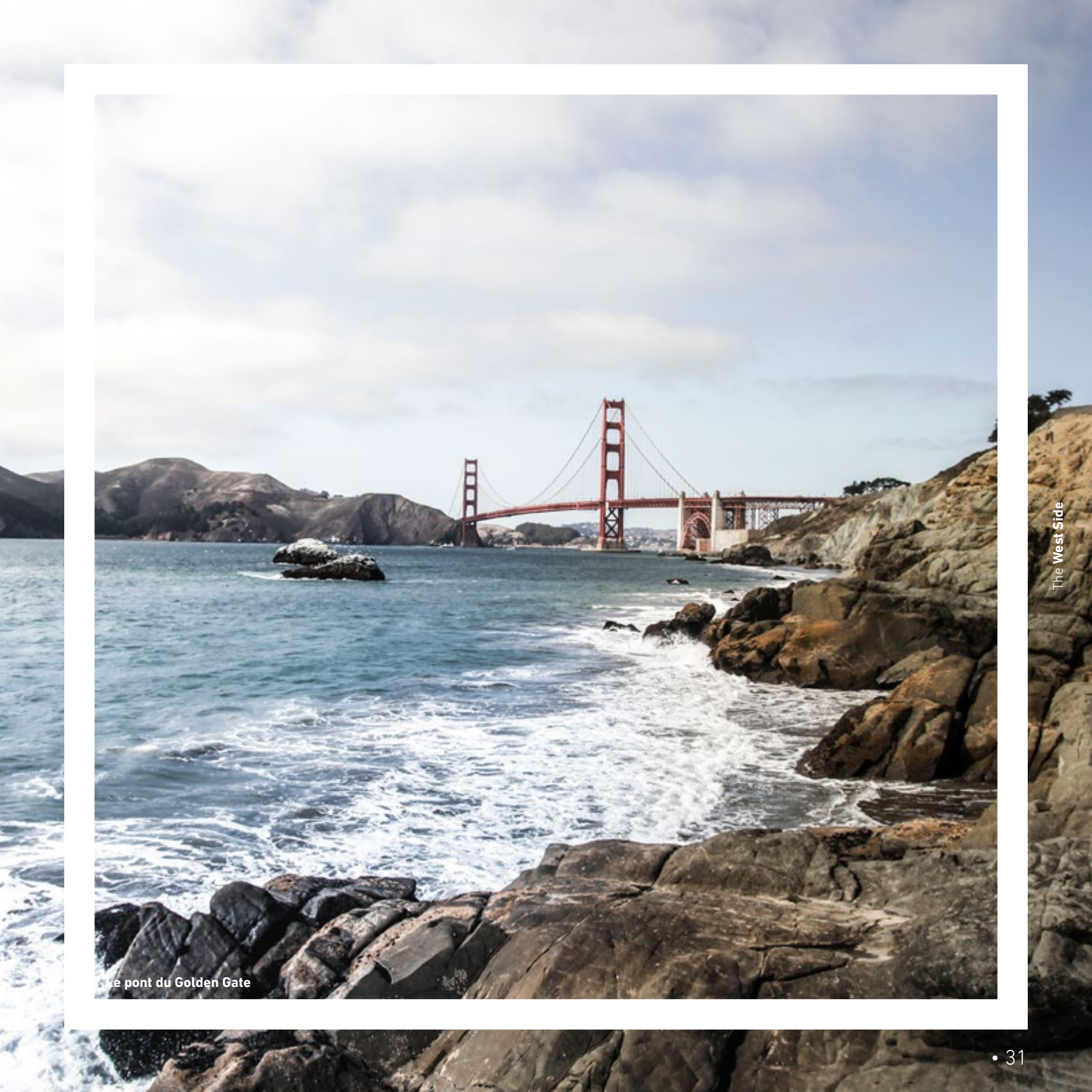
Le pont du Golden Gate

Aujourd'hui la ruée vers le nouvel Or, la technologie, en fait une des villes les plus chères des Etats-Unis. Attirant les nouveaux pionniers des années 2000. La ville est extrêmement cosmopolite.