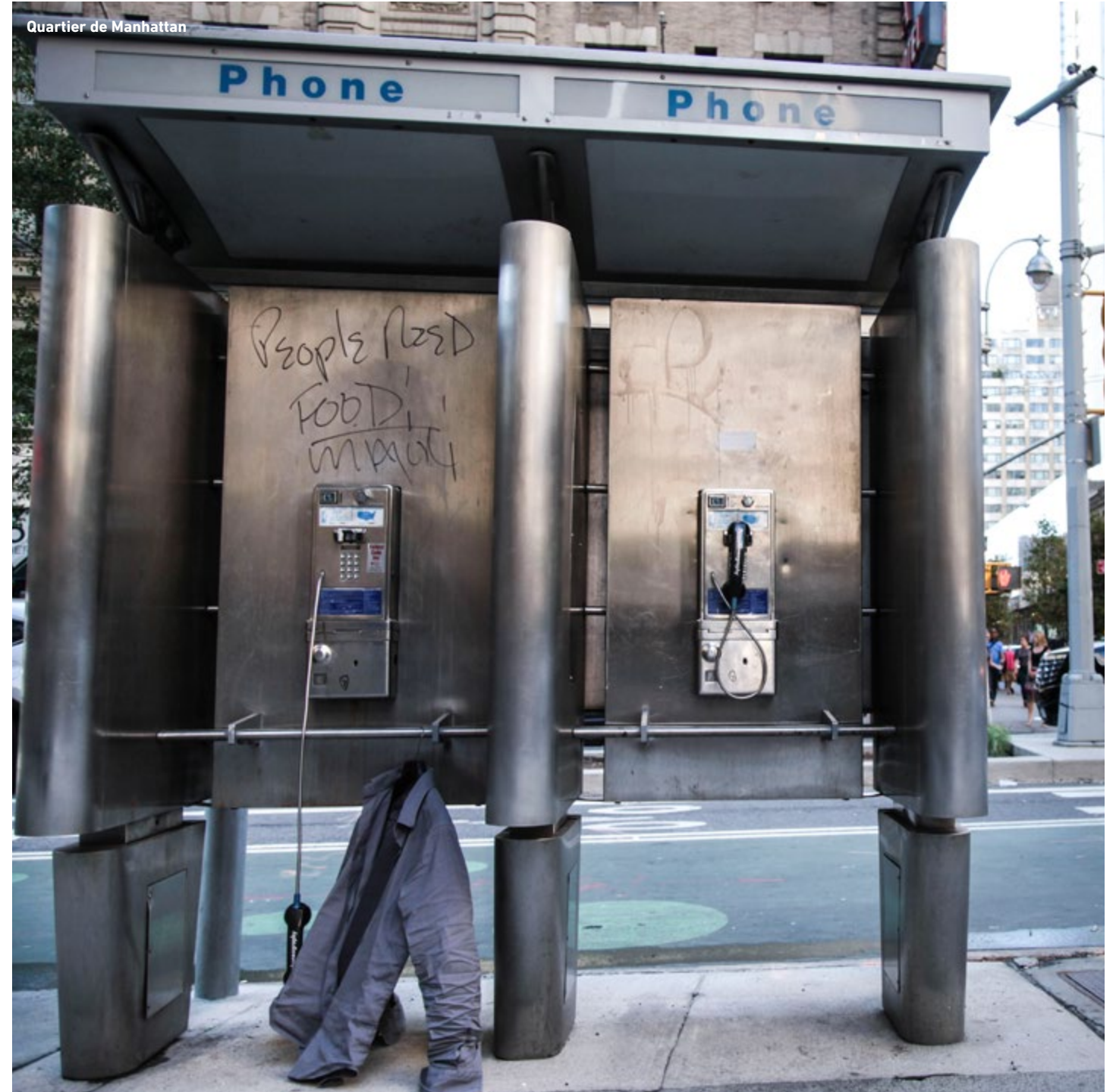
Quartier de Manhattan