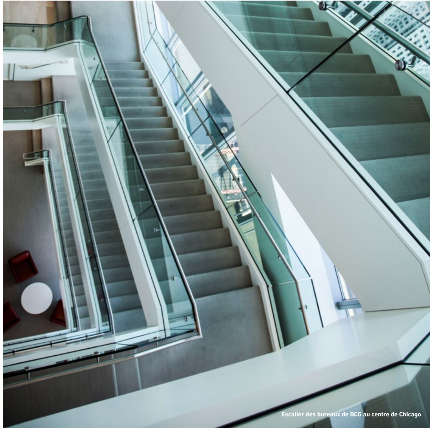
Escalier des bureaux de BCG au centre de Chicago

“Jusqu’à Gutenberg, l’ architecture est l’écriture principale, l’écriture universelle.”