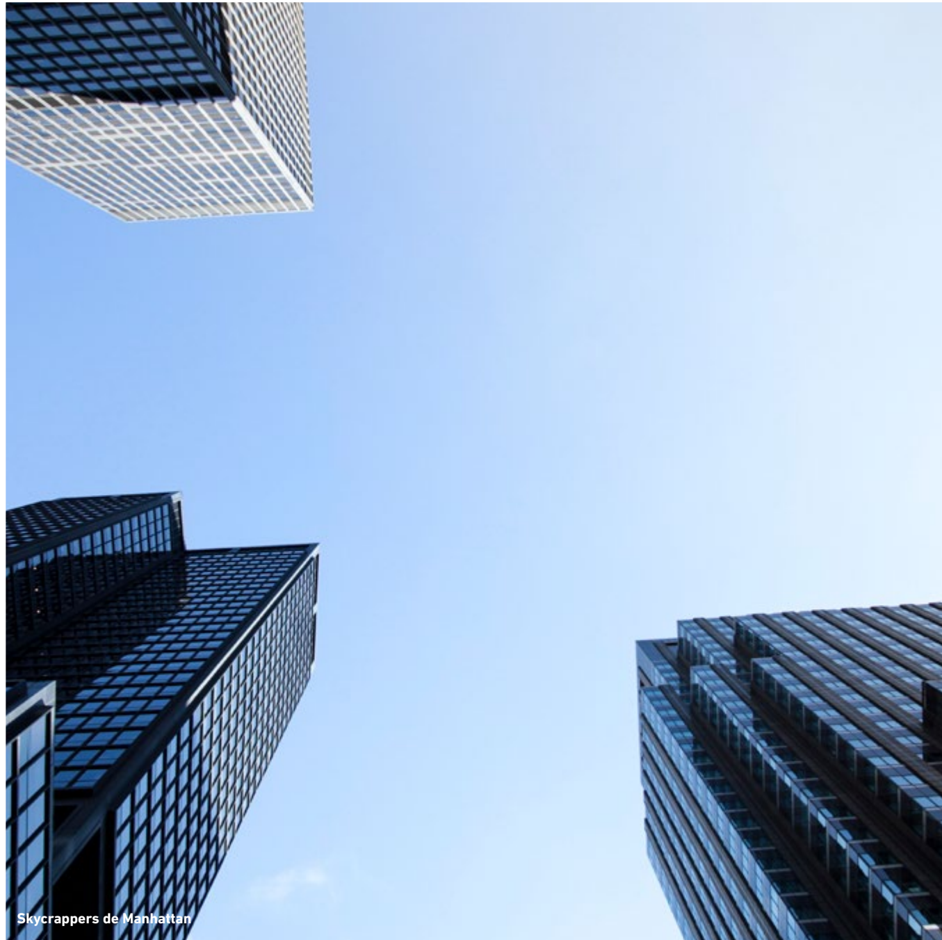
Skycrappers de Manhattan