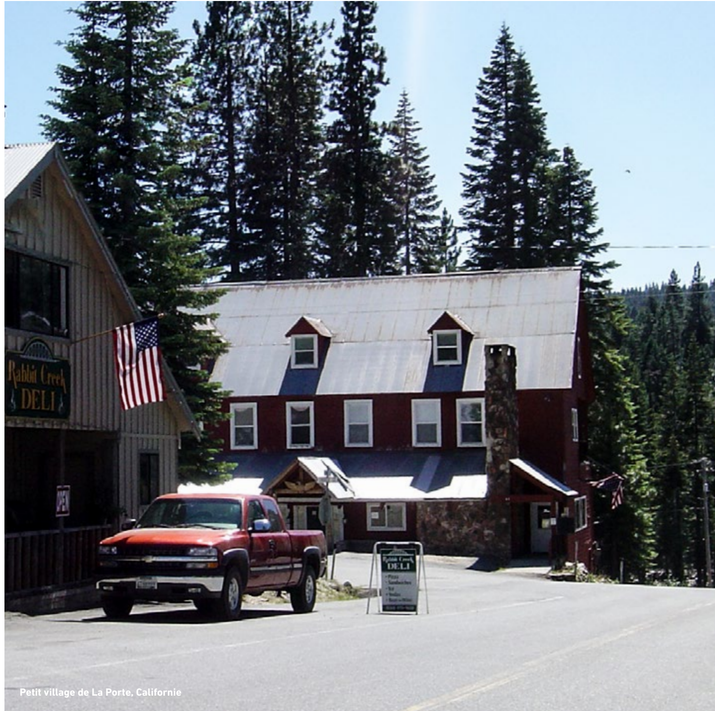
Petit village de La Porte, Californie

“Le vrai pouvoir, c’est la connaissance.”