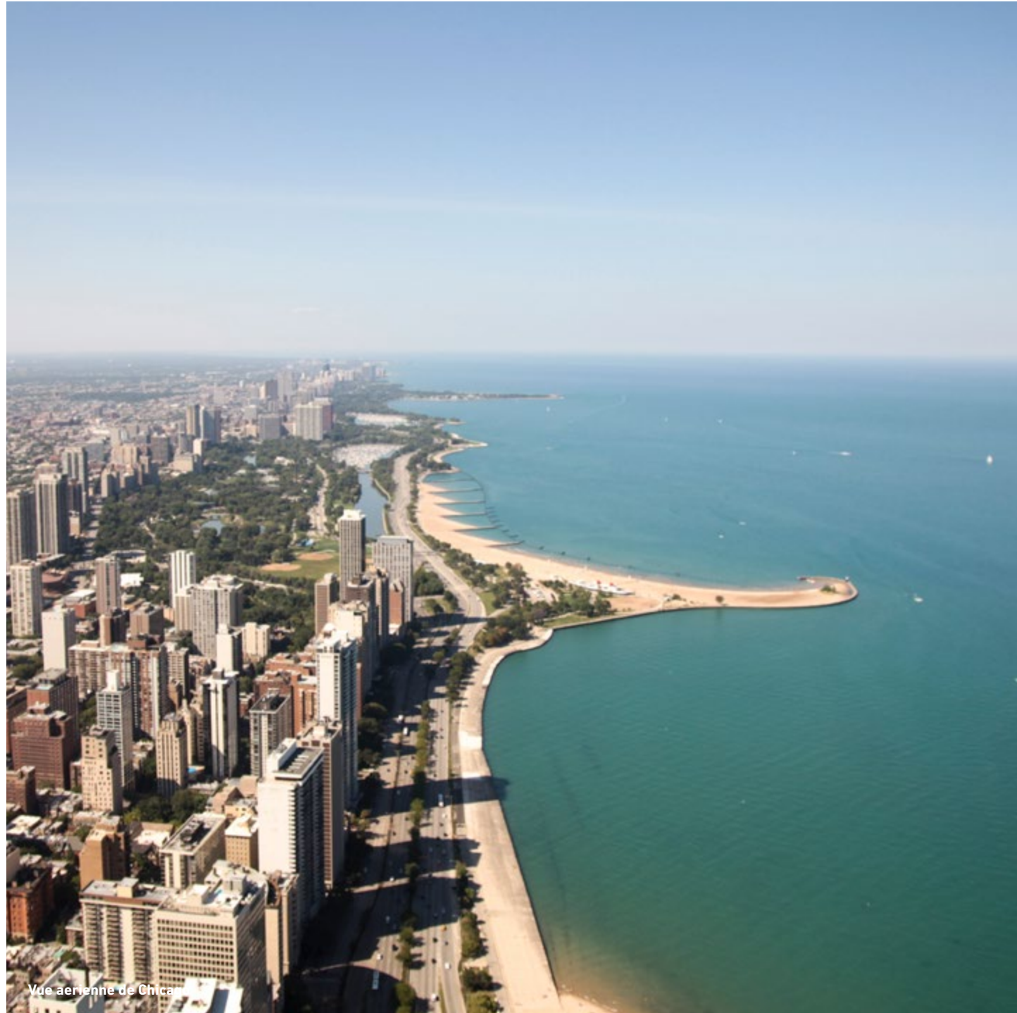
Vue aeriennne de Chica

“Tout obstacle renforce la détermination . Celui qui s’est fixé un but n’en change pas.”