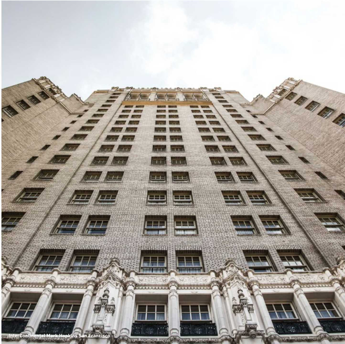
InterContinental Mark Hopkins San Francisco