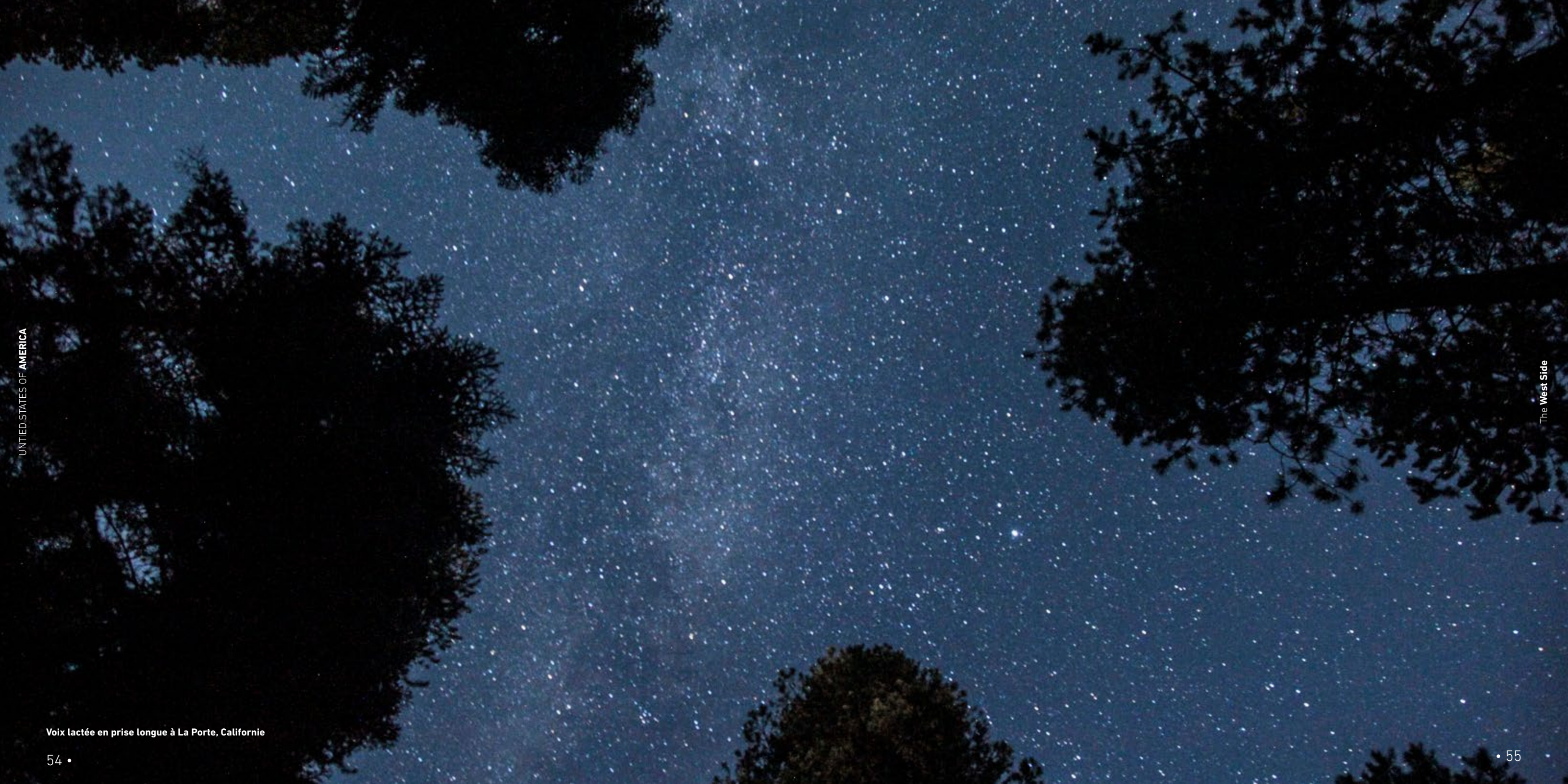
Voix lactée en prise longue à La Porte, Californie