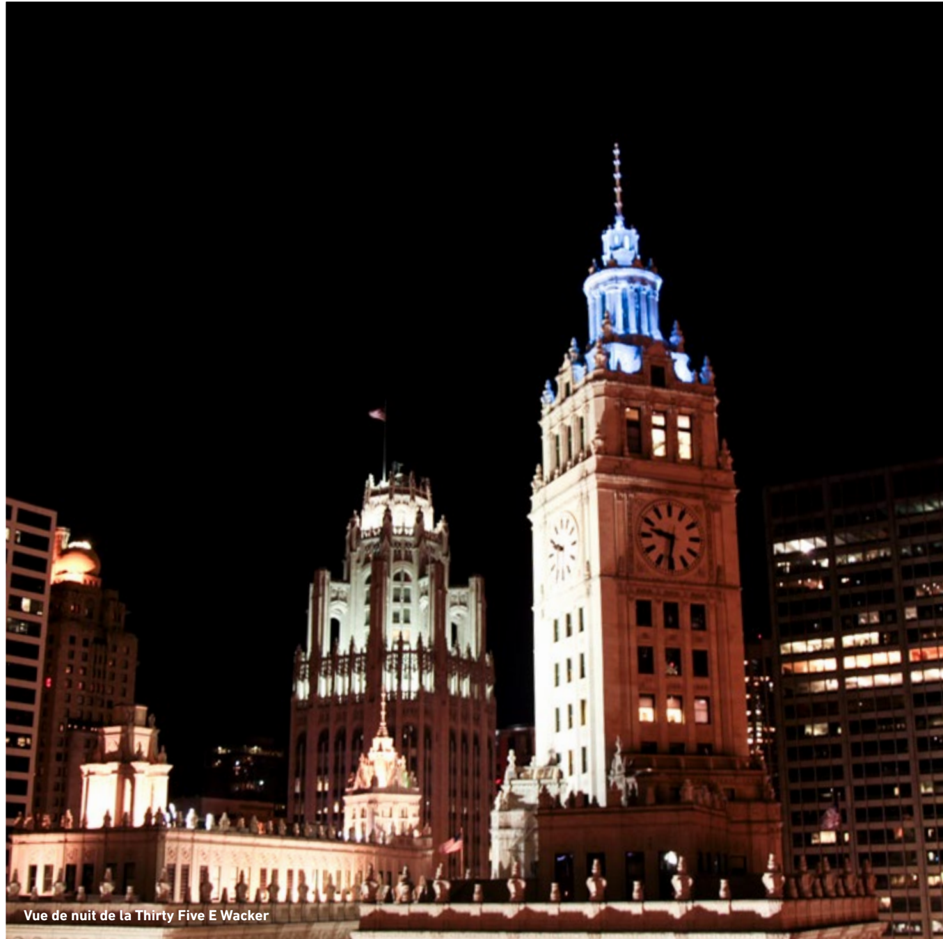
Vue de nuit de la Thirty Five E Wacker