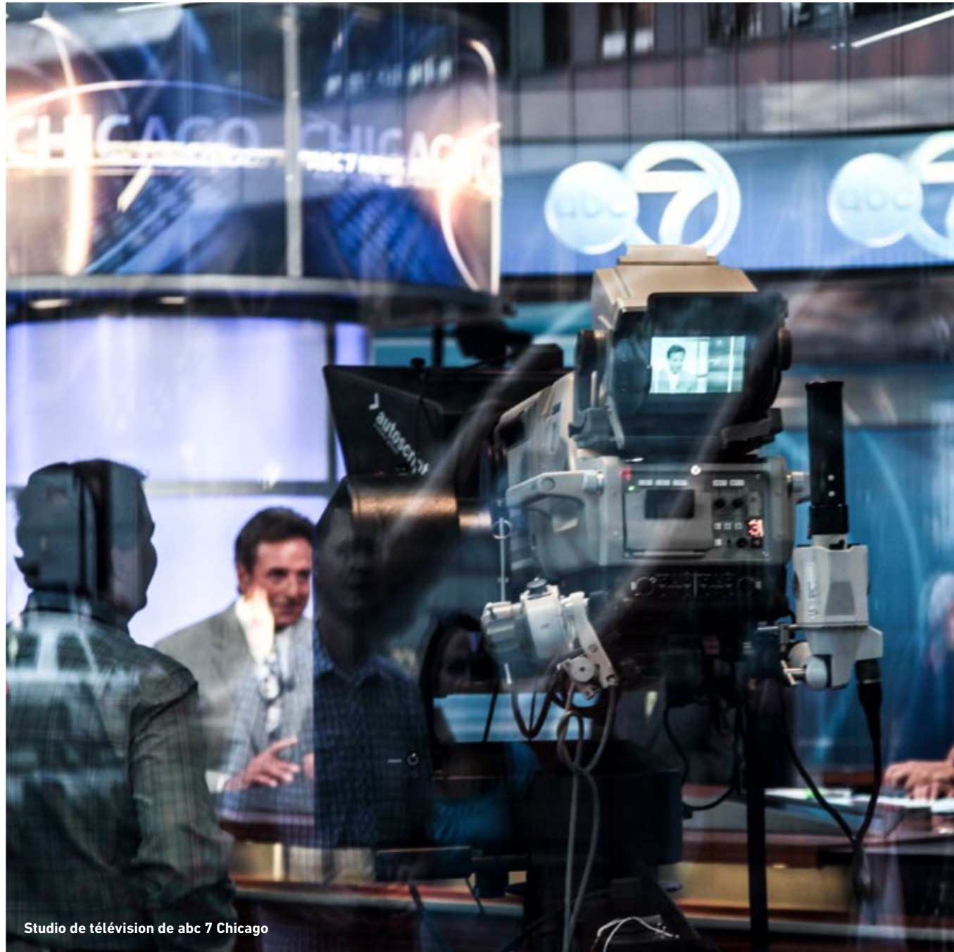
Studio de télévision de abc 7 Chicago