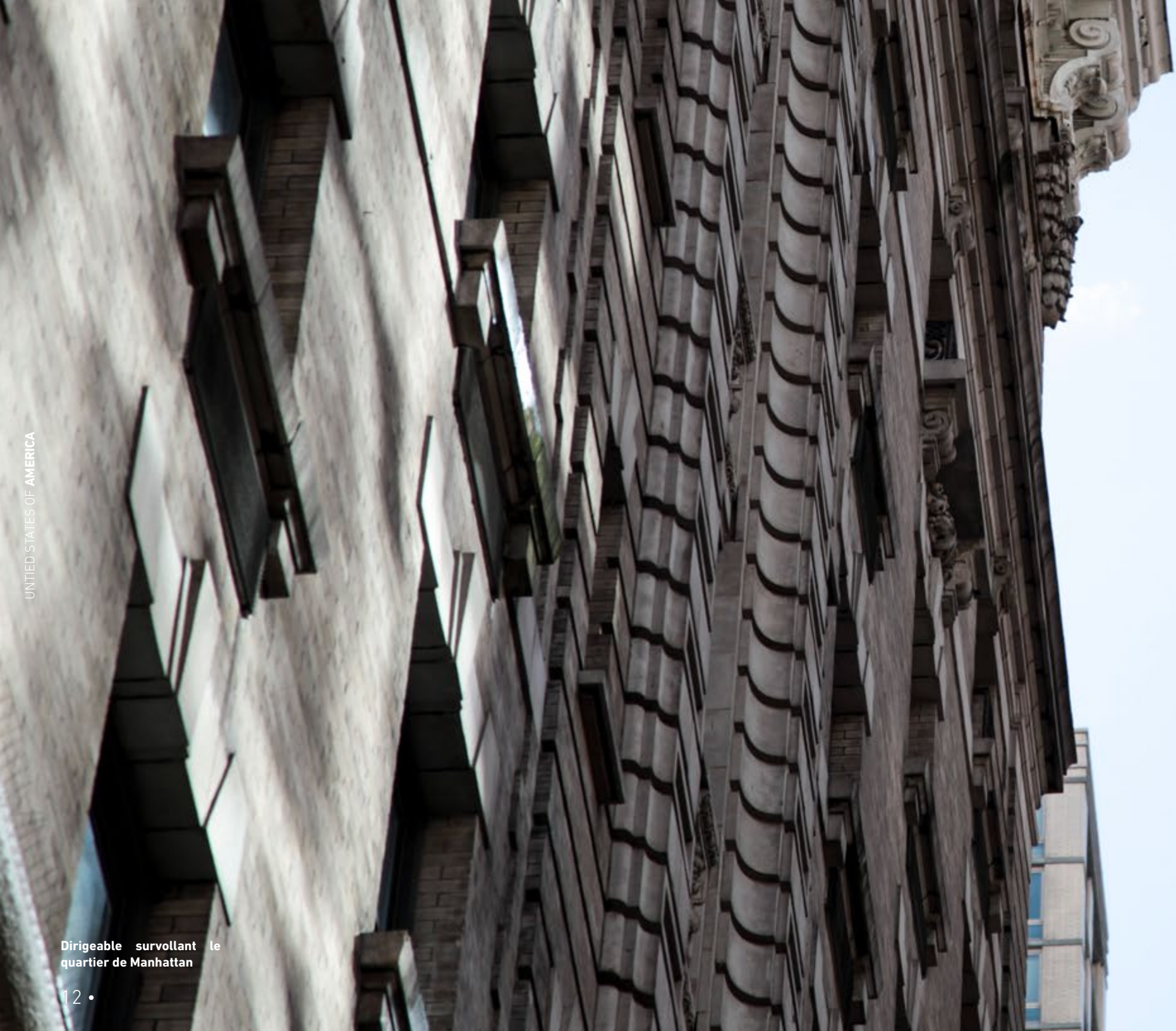
Dirigeable survollant le quartier de Manhattan