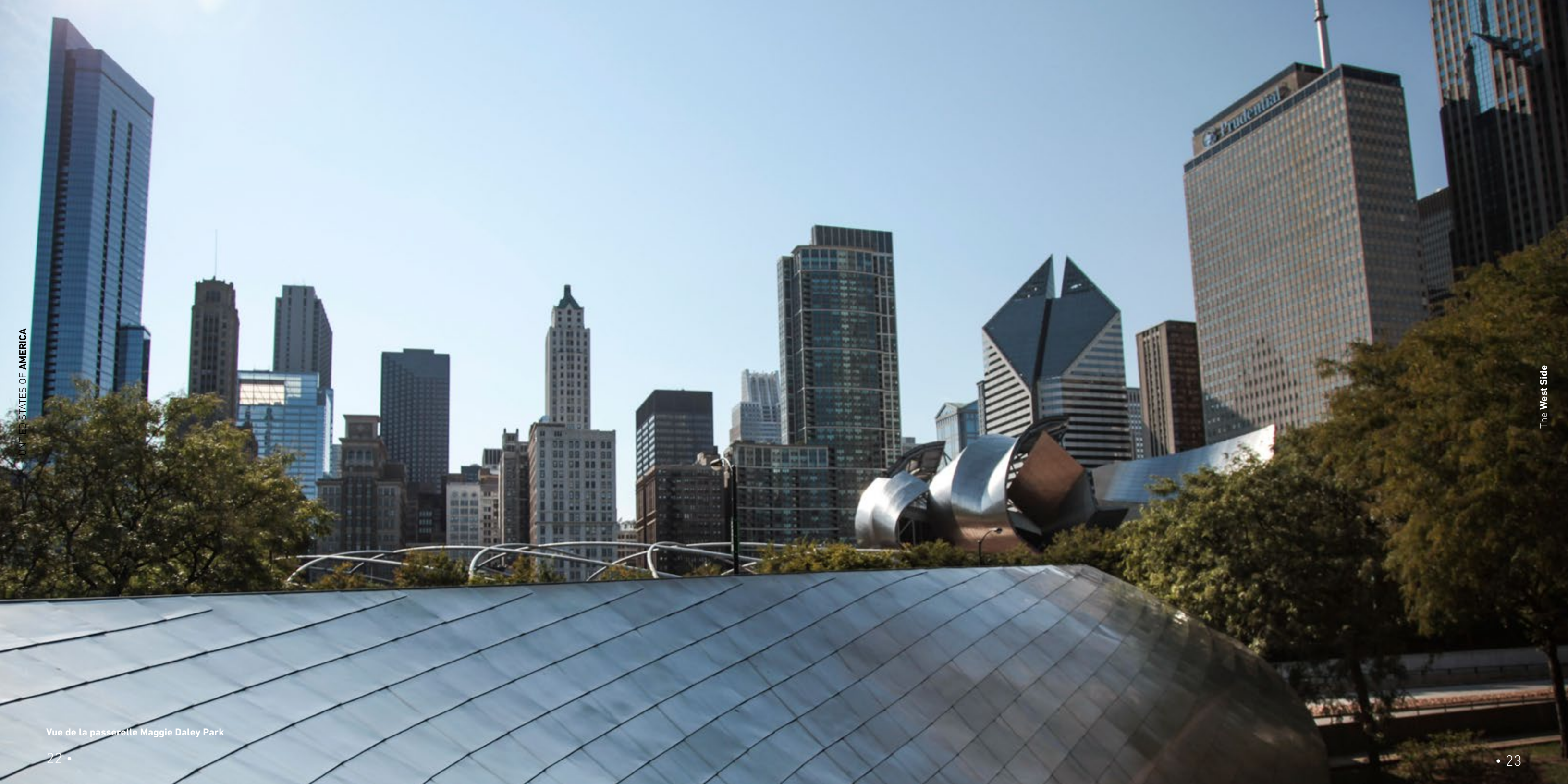
Vue de la passerelle Maggie Daley Park