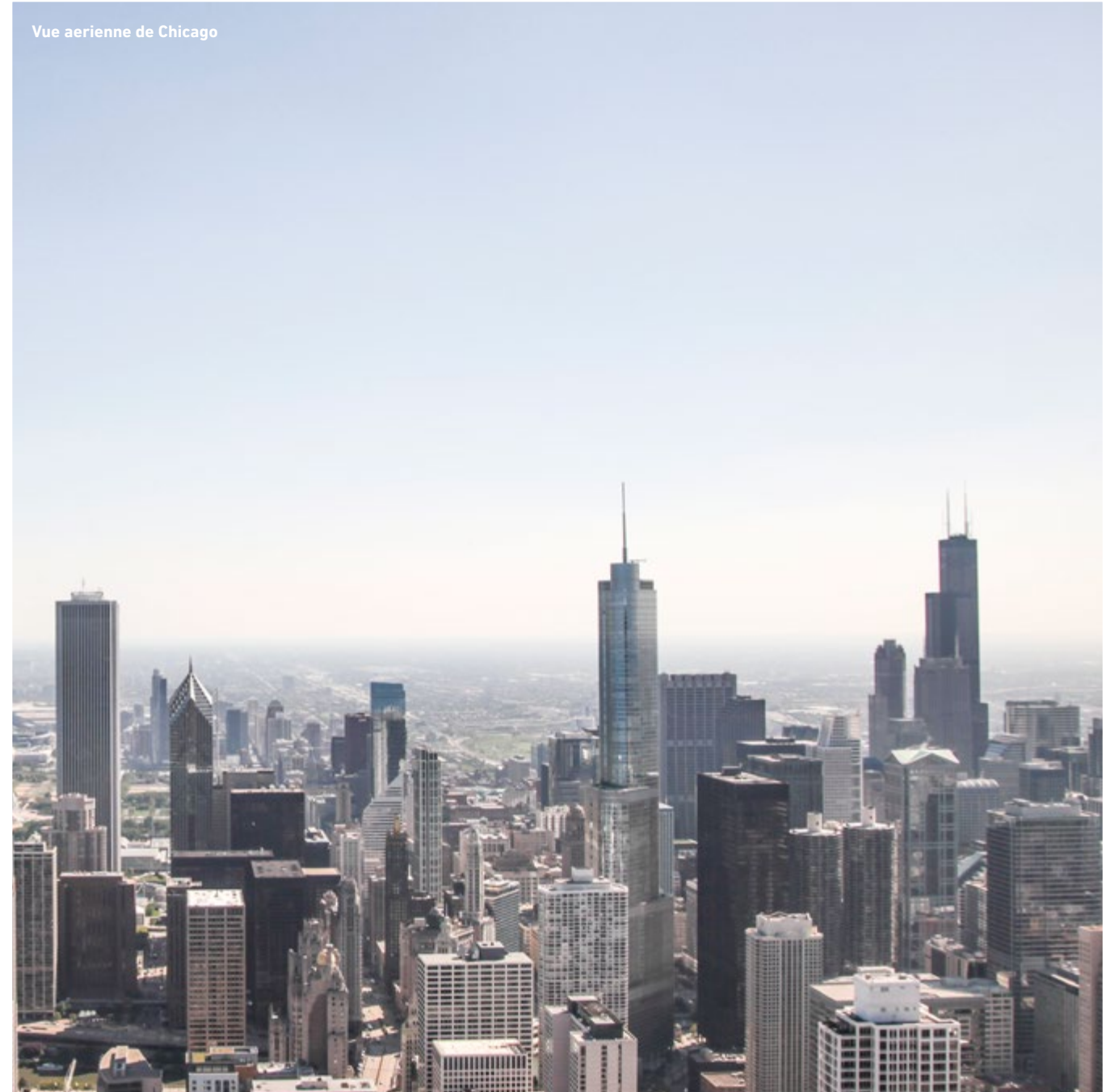
Vue aeriene de Chicago

Ville industrielle de la "Rust Belt" par excellence ayant évolué comme centre économique et Artistique majeur des USA. Fasciné par son architecture variée, cette ville au bord du lac Michigan, au climat doux l'été et extrêmement froid l'hivers est un petit bijoux où l'on prend un réel plaisir à arpenter les rues, à découvrir chacunes de ses facettes.