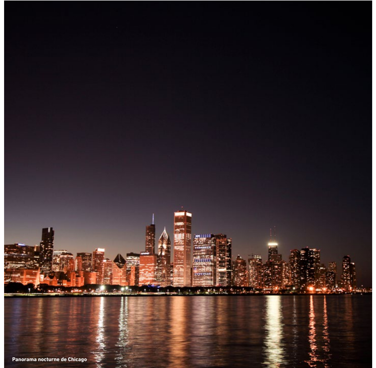
Panorama nocturne de Chicago