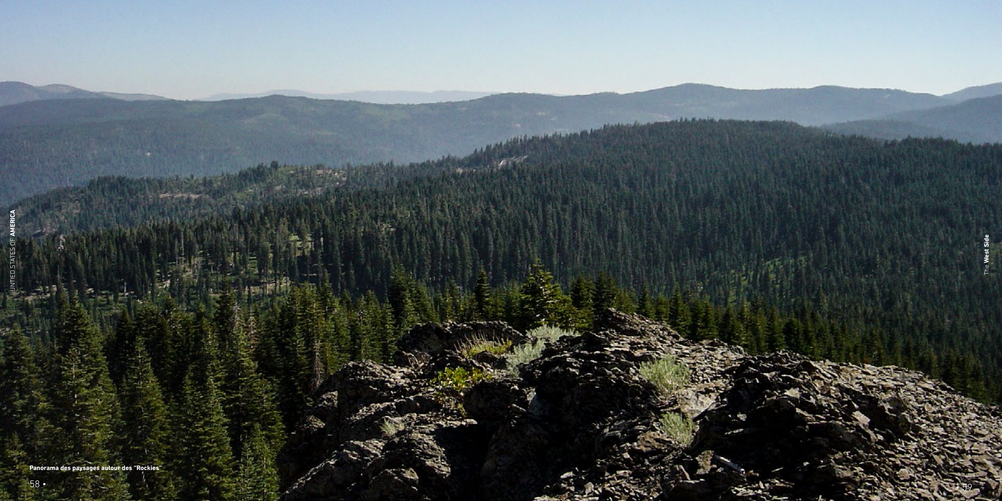
Panorama des paysages autour des "Rockies"