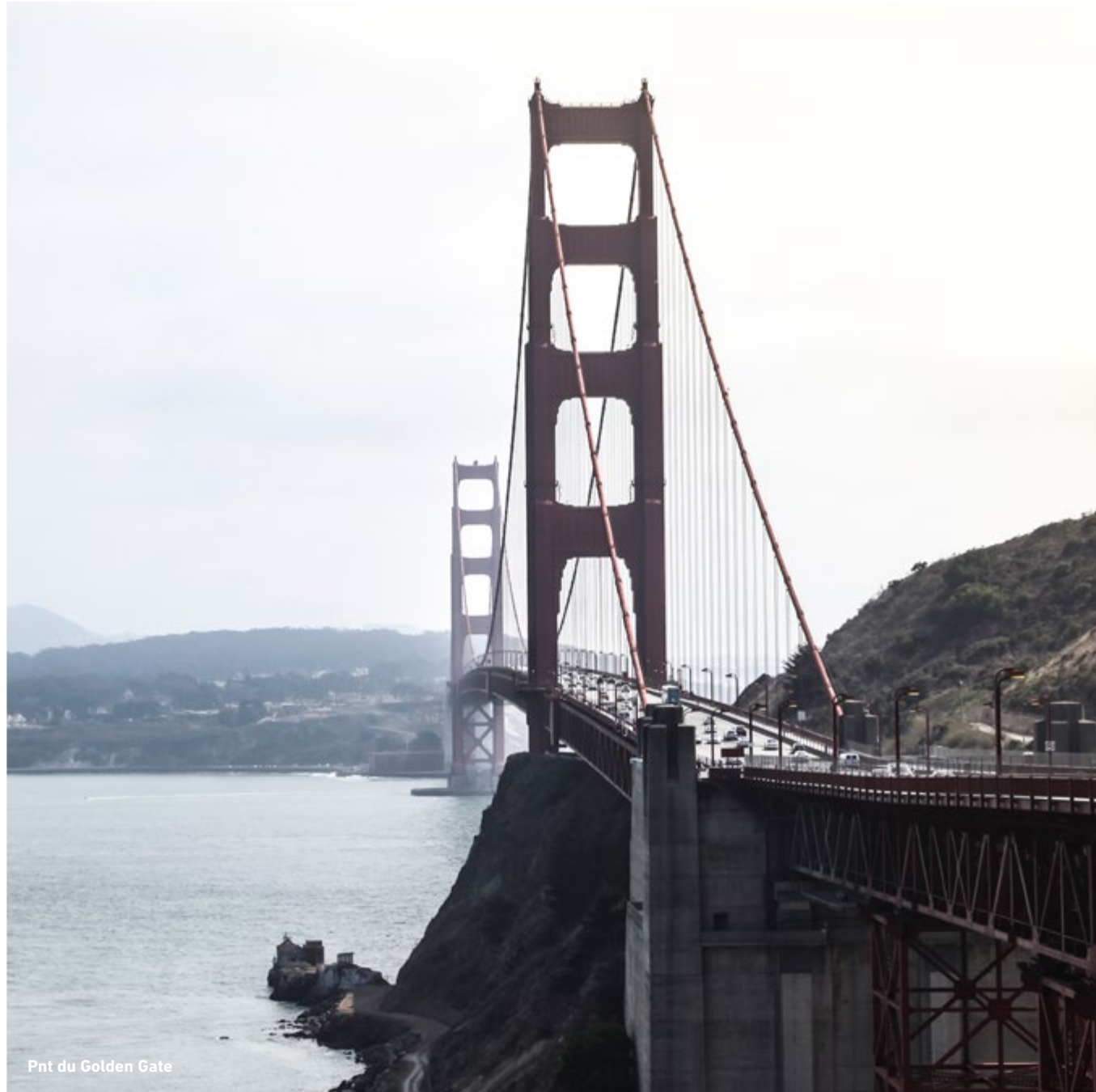
Pnt du Golden Gate