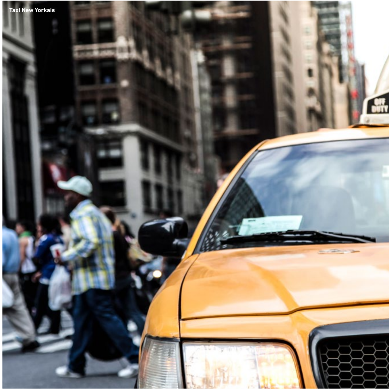
Taxi New Yorkais