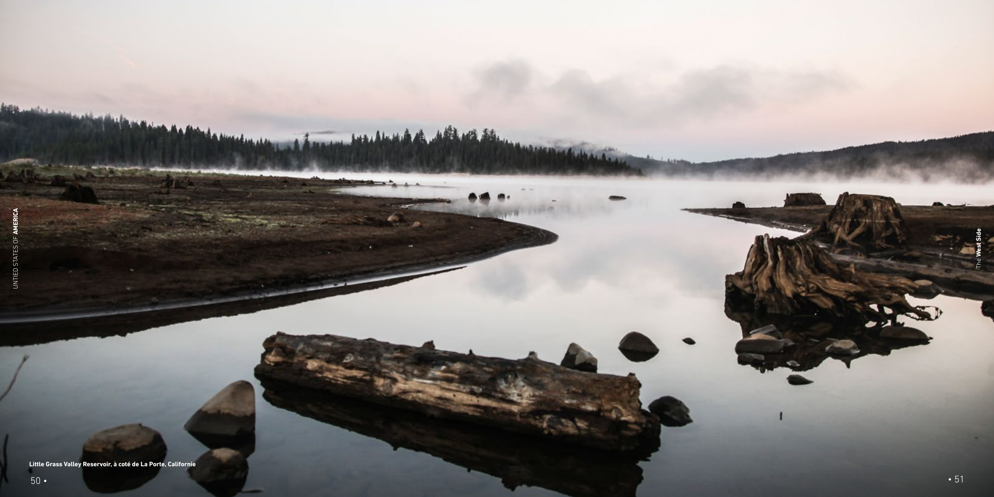
Little Grass Valley Reservoir, à côté de La Porte, Californie