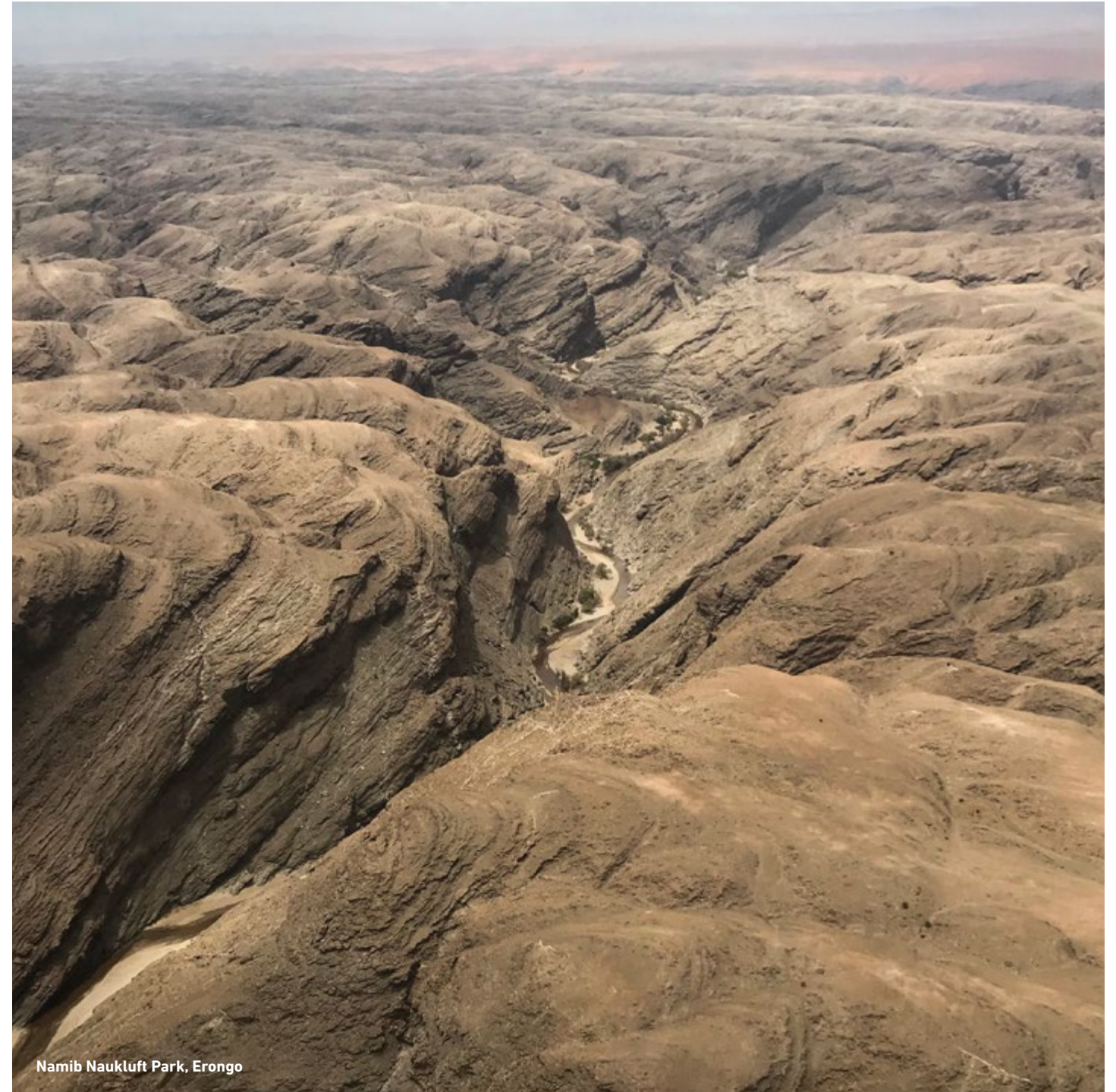
Namib Naukluft Park, Erongo