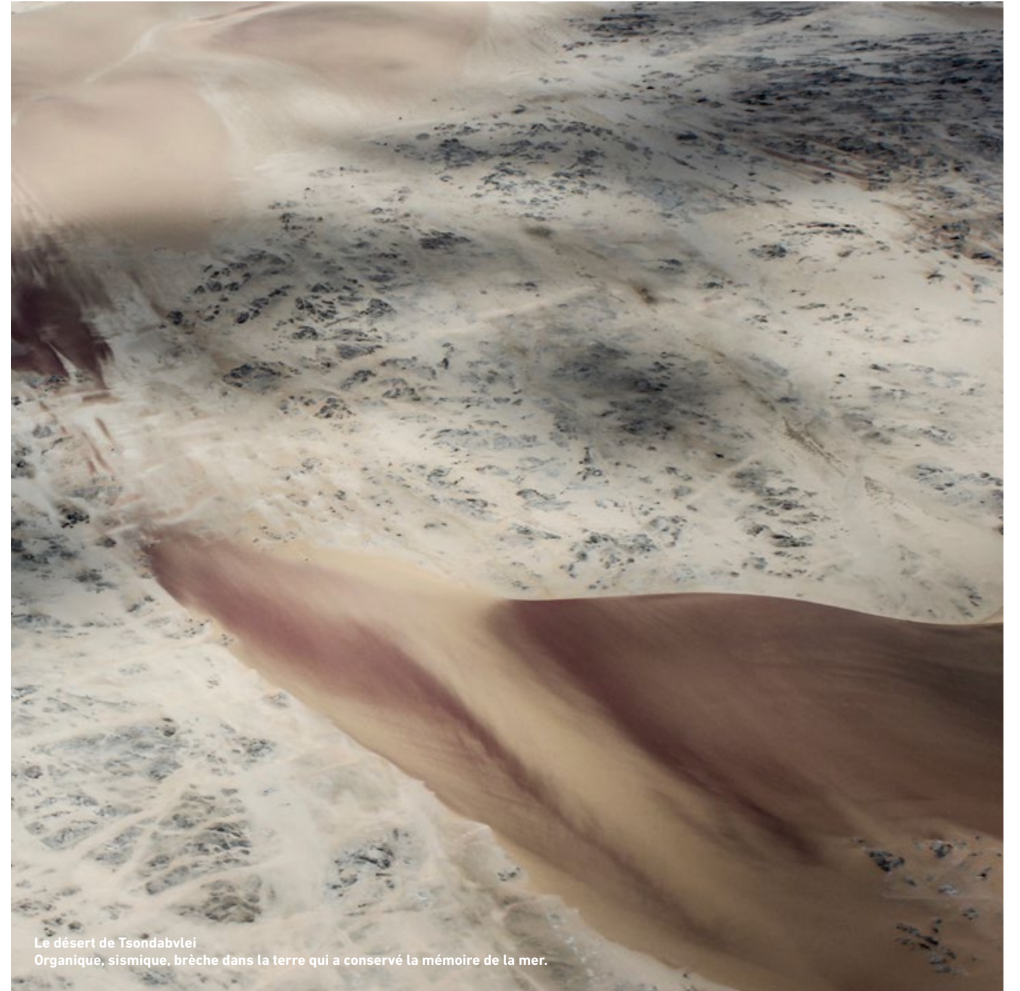
Le désert de Tsondabvlei Organique, sismique, brèche dans la terre qui a conservé la mémoire de la mer.