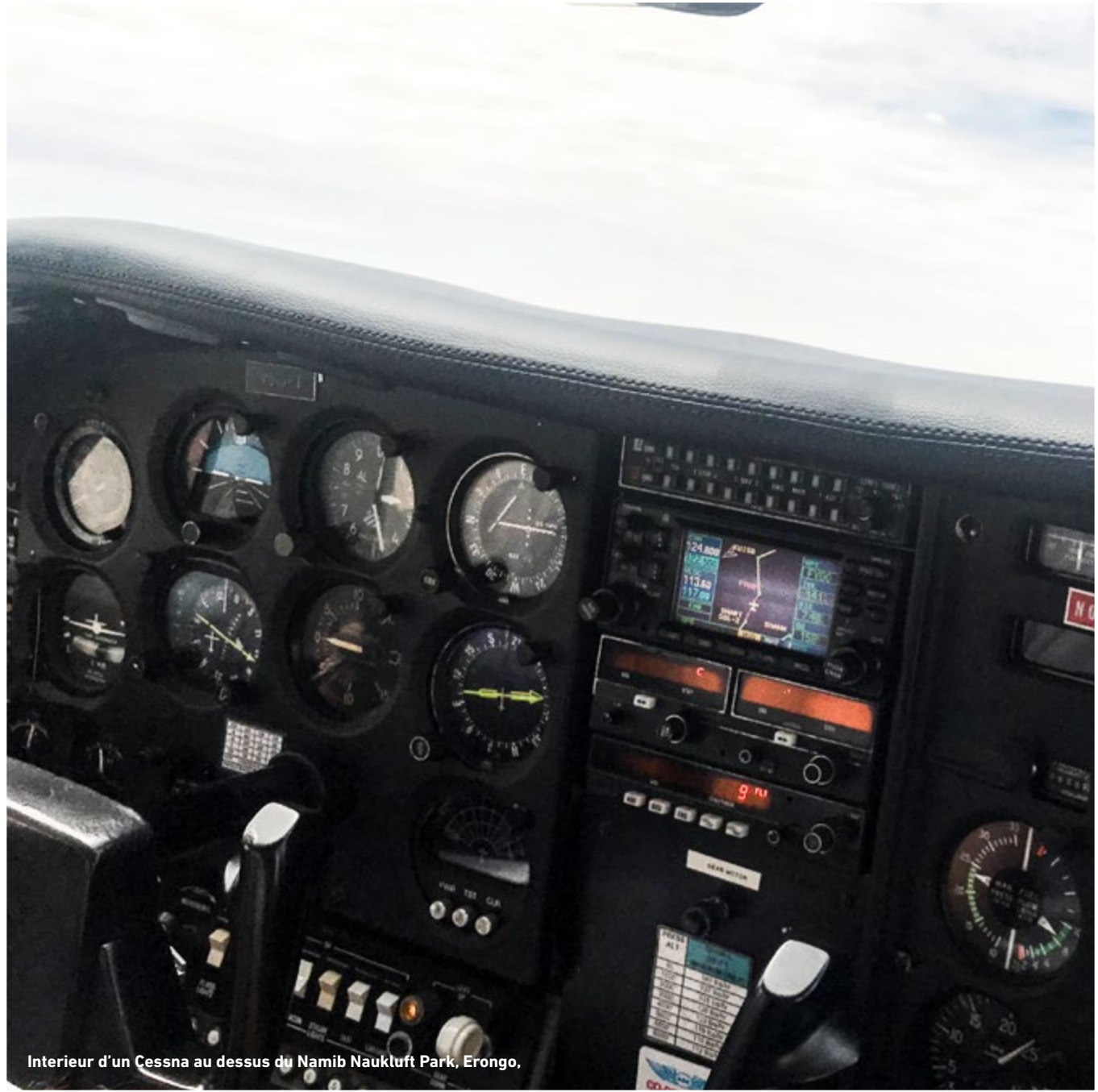
Interieur d'un Cessna au dessus du Namib Naukluft Park, Erongo.