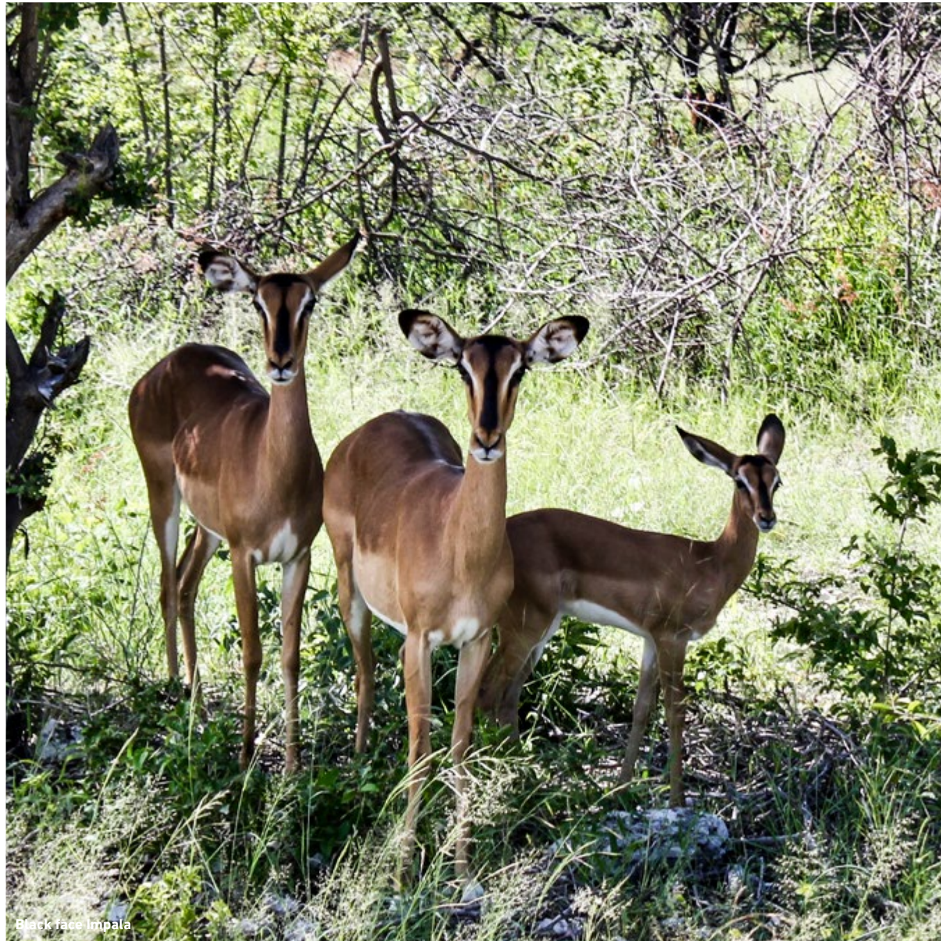
Black face Impala