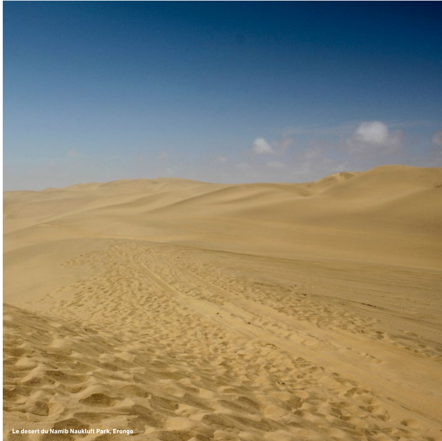
Le desert du Namib Naukluft Park, Erongo