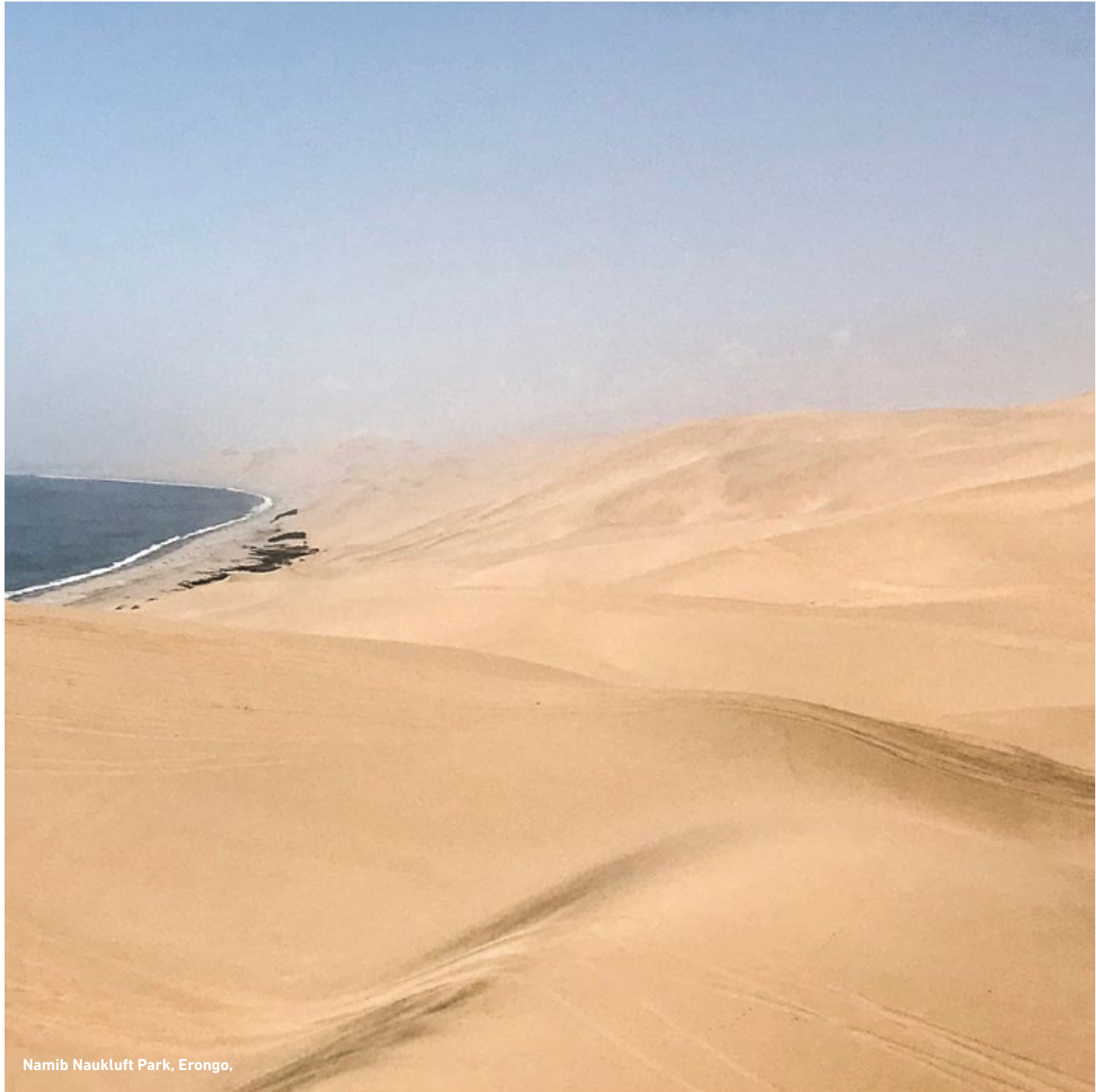
Namib Naukluft Park, Erongo.