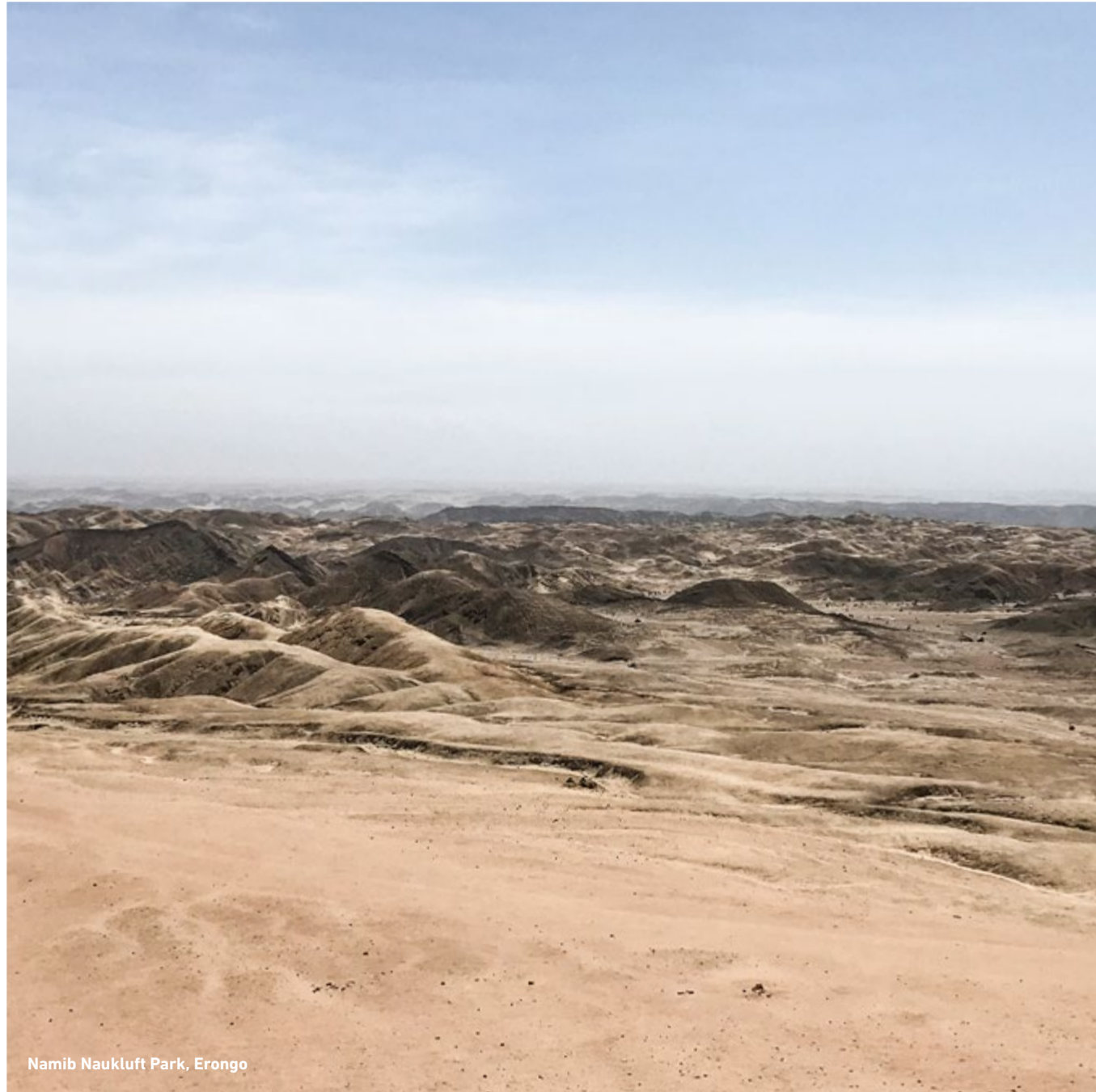
Namib Naukluft Park, Erongo