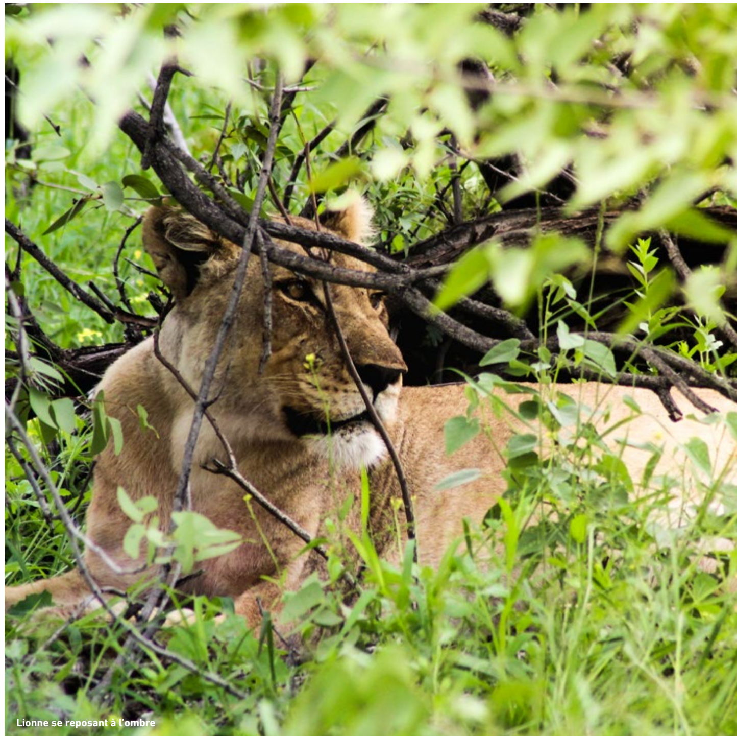
Lionne se reposant à l'ombre

“Je sais, quand il le faut, quitter la peau du lion pour prendre celle du renard. ”