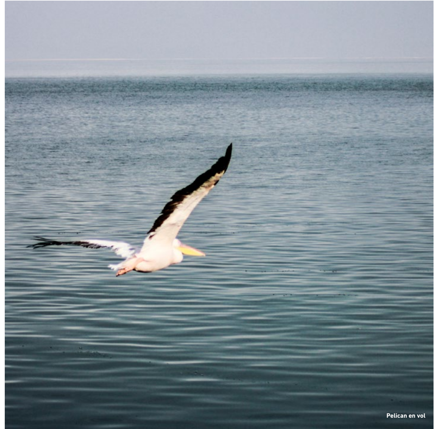
Pelican en vol