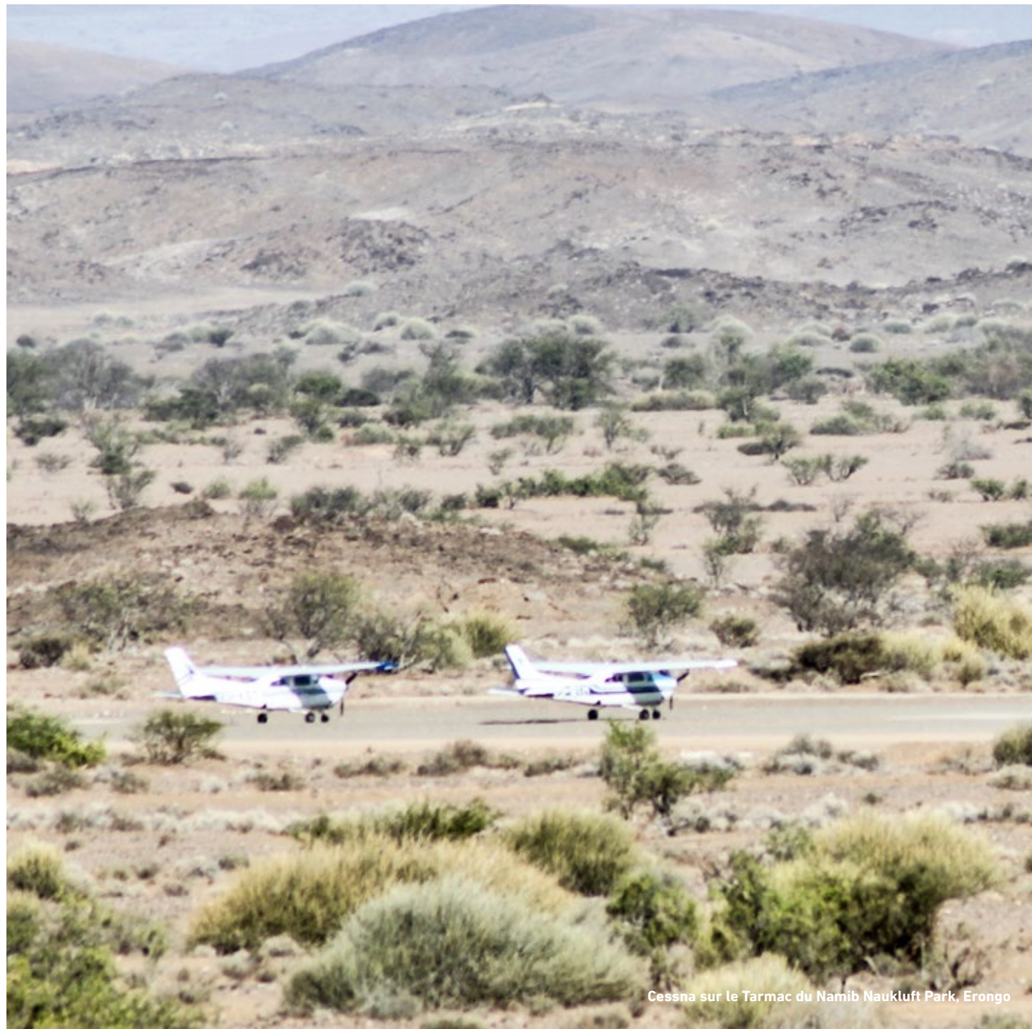
Cessna sur le Tarmac du Namib Naukluft Park, Erongo

“L'imagination dispose de tout; elle fait la beauté , la justice et le bonheur qui est le tout du monde ”