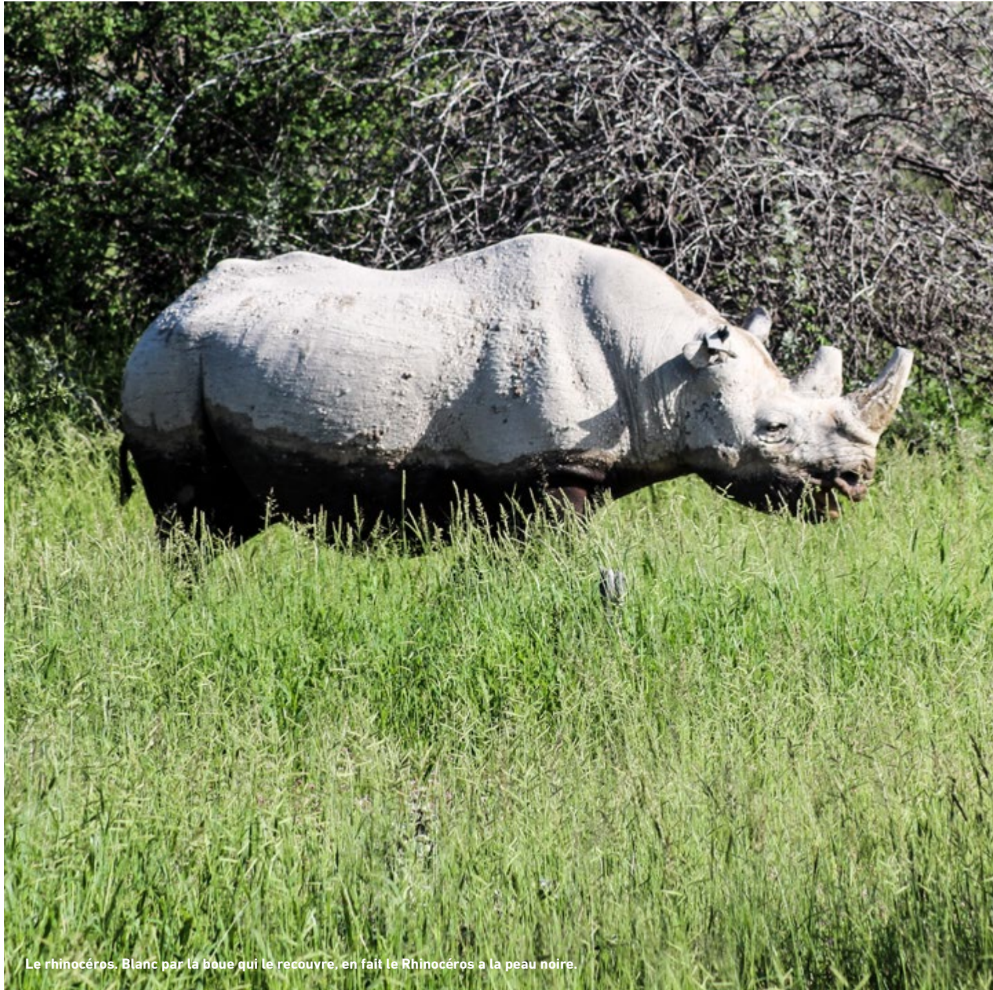
Le rhinocéros. Blanc par la boue qui le recouvre, en fait le Rhinocéros à la peau noire.

“Qui blâme la peinture blâme la nature. ”