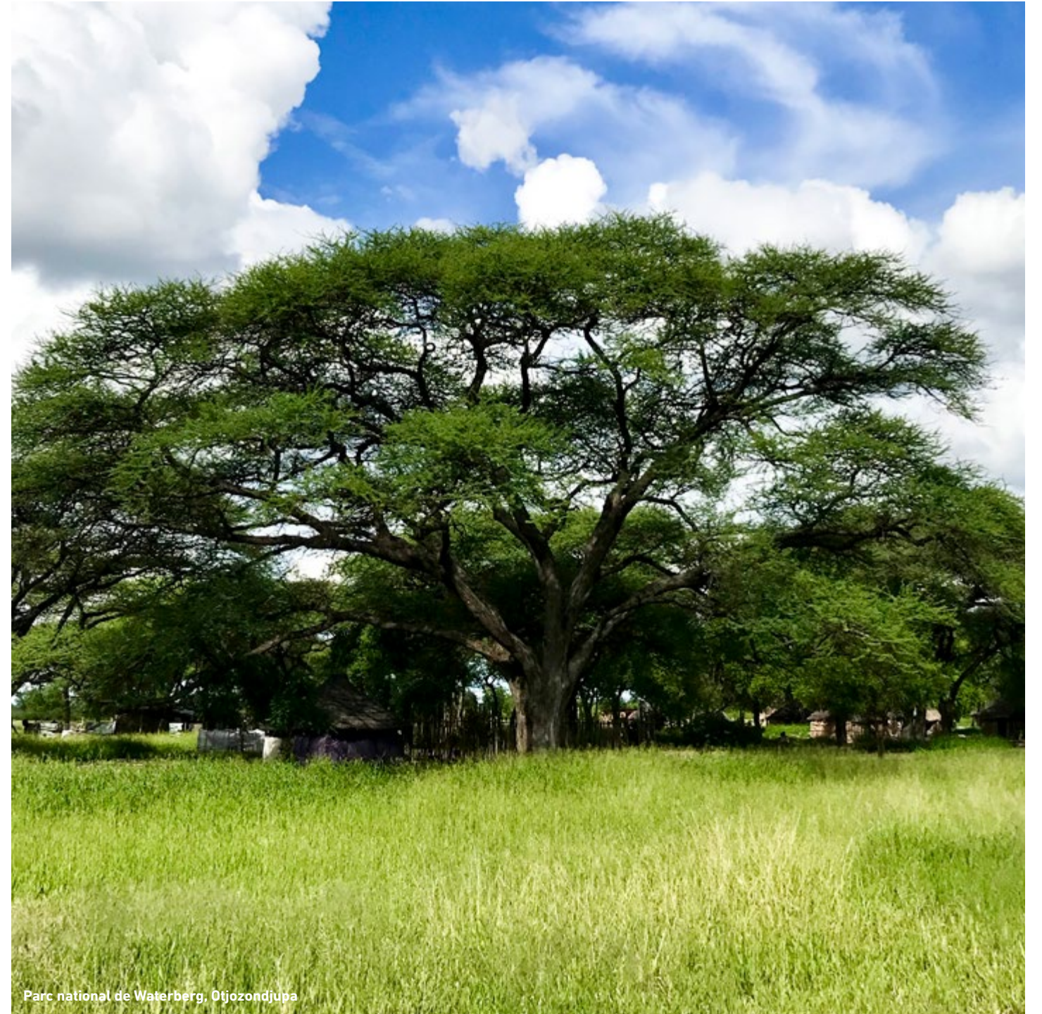
Parc national de Waterberg, Otjozondjupa