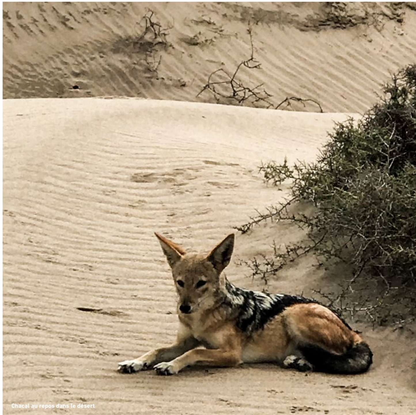
Chacal au repos dans le désert

“Aimez demain si vous savez l’amour; aimez demain si vous n’en savez rien.”