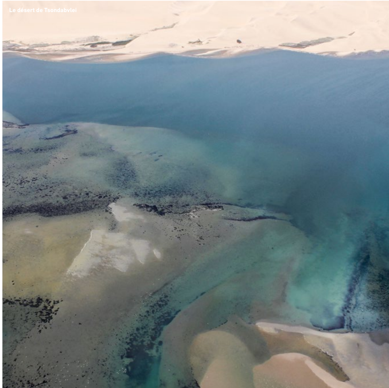
Le désert de Tsondabvlei