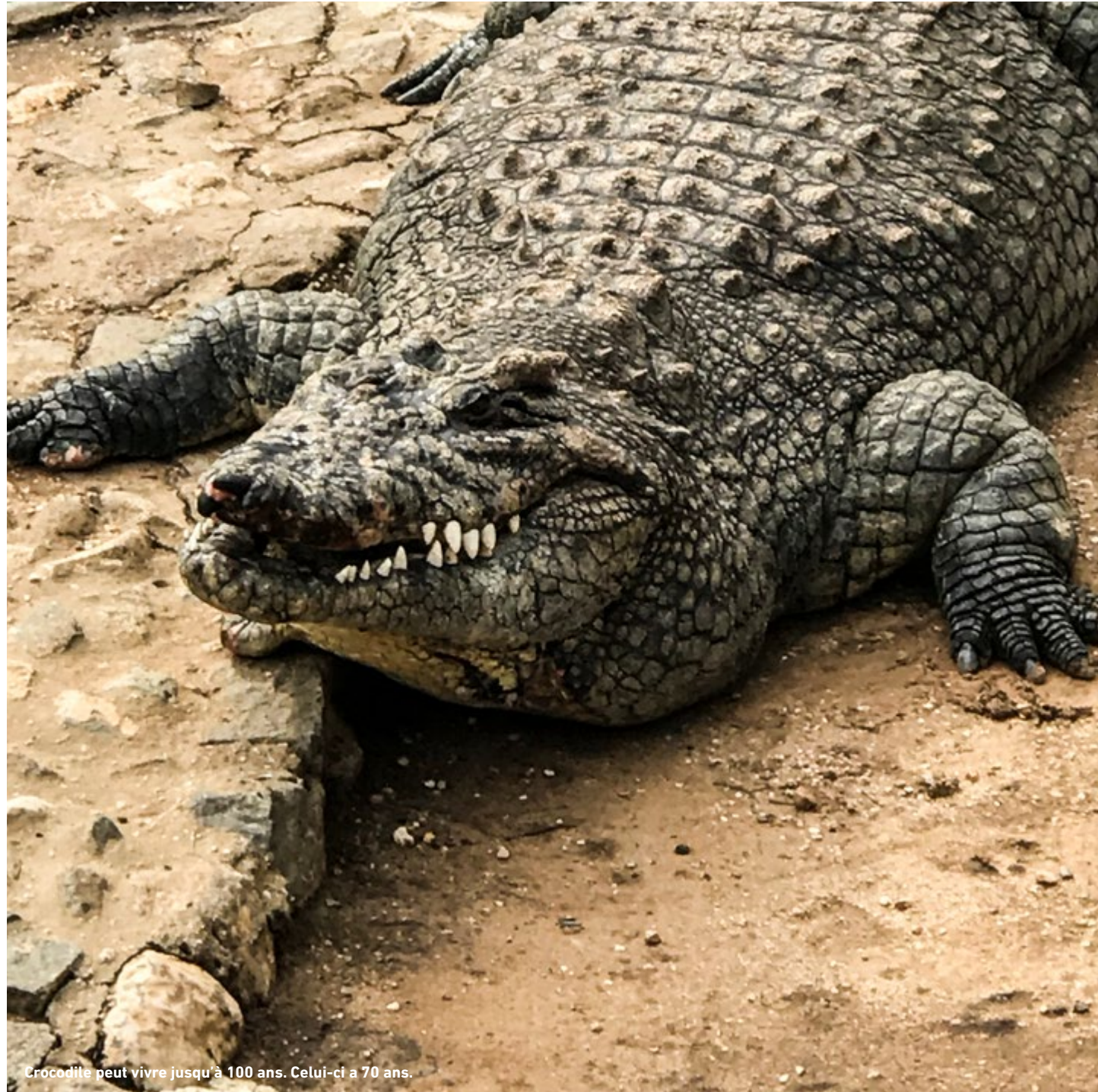
Crocodile peut vivre jusqu'à 100 ans. Celui-ci a 70 ans.

“Les amours passent et meurent; l'Amour demeure et survit.”