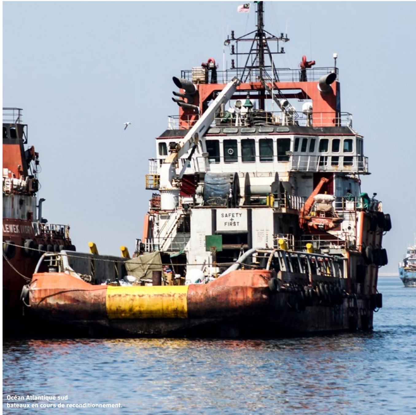
Océan Atlantique sud bateaux en cours de reconditionnement.