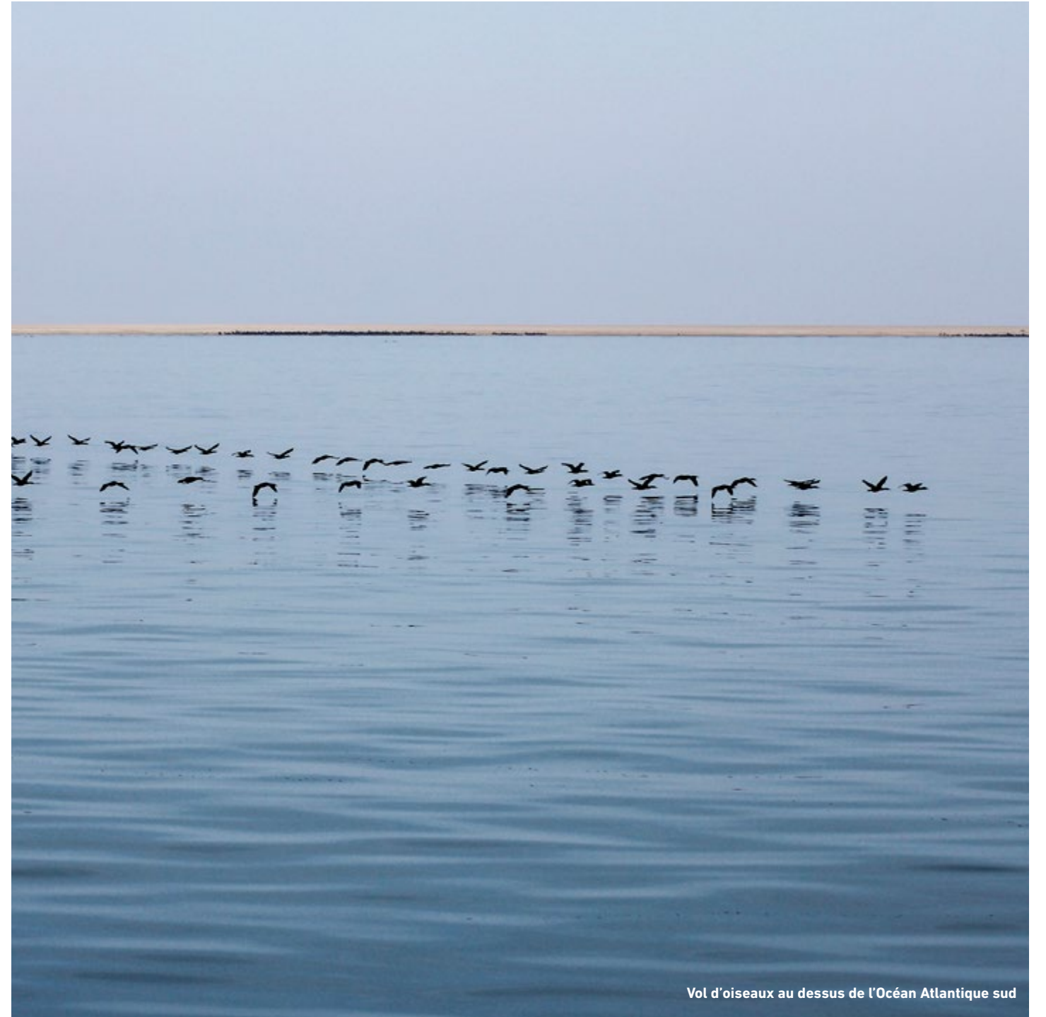
Vol d'oiseaux au dessus de l'Océan Atlantique sud