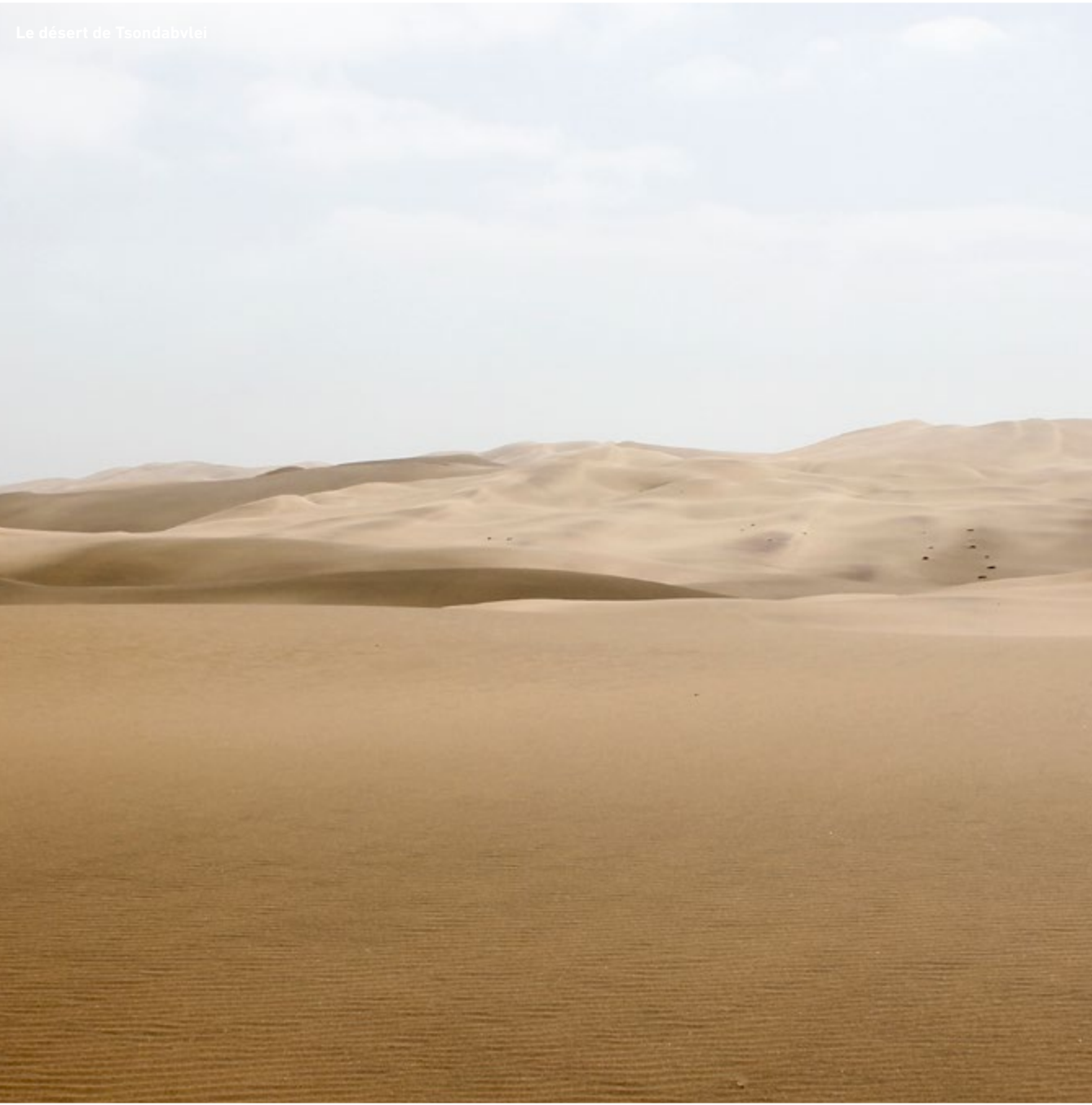
Le désert de Tsondabvlei

L'infini du Désert touche l'âme, sans limite et nous fait ressentir le sublime... Souffle coupé, sens en éveil, nous devenons amoureux du silence qui devient le plus merveilleux chuchoteur.