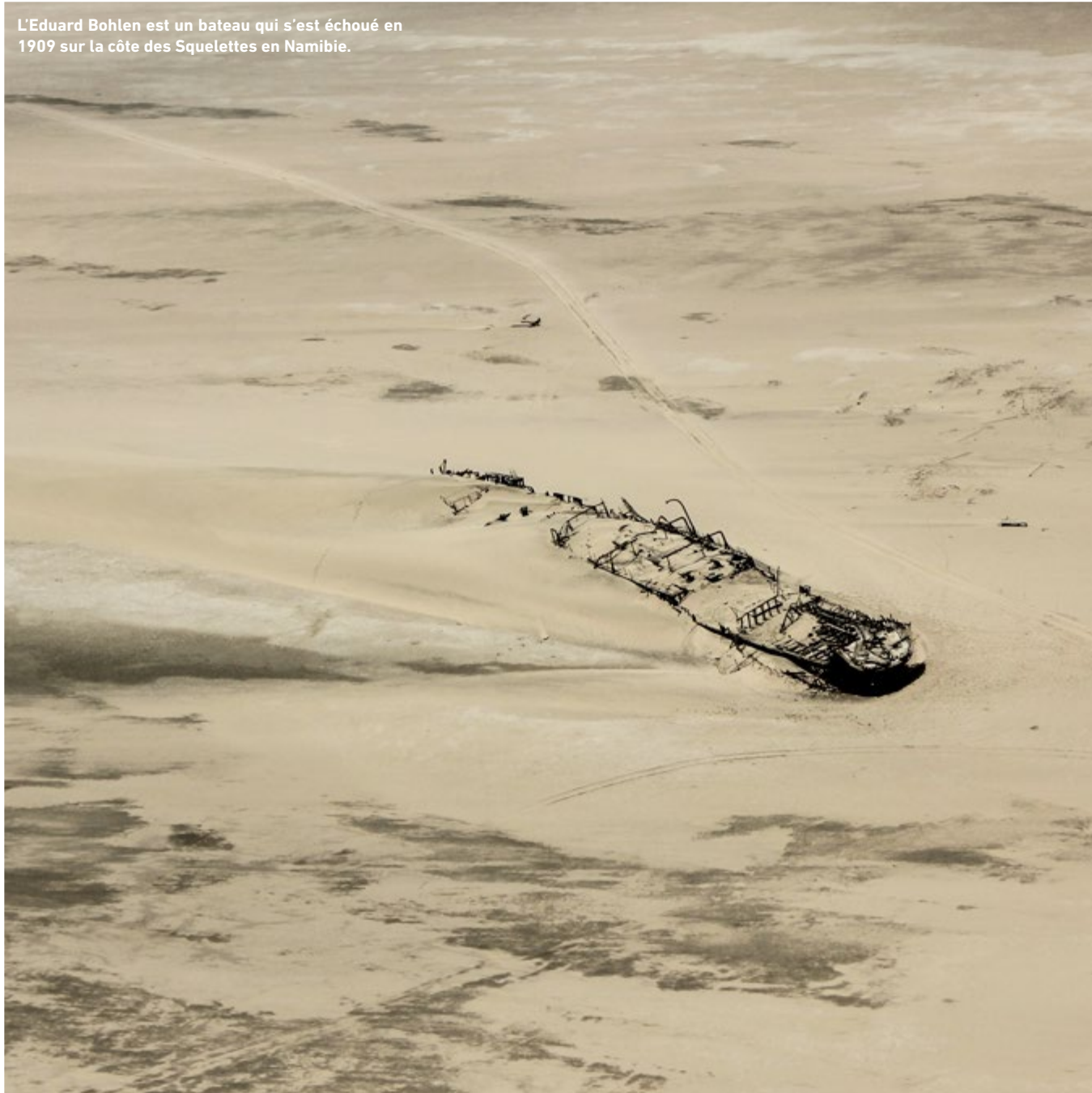
L'Eduard Bohlen est un bateau qui s'est échoué en 1909 sur la côte des Squelettes en Namibie.