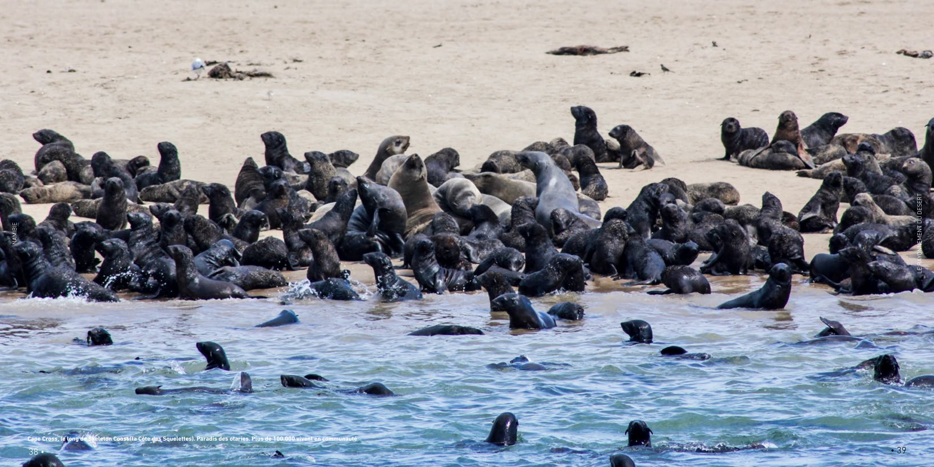
Cape Cross, le long de Skeleton Coast (la Côte des Squelettes). Paradis des otaries. Plus de 100.000 vivent en communauté