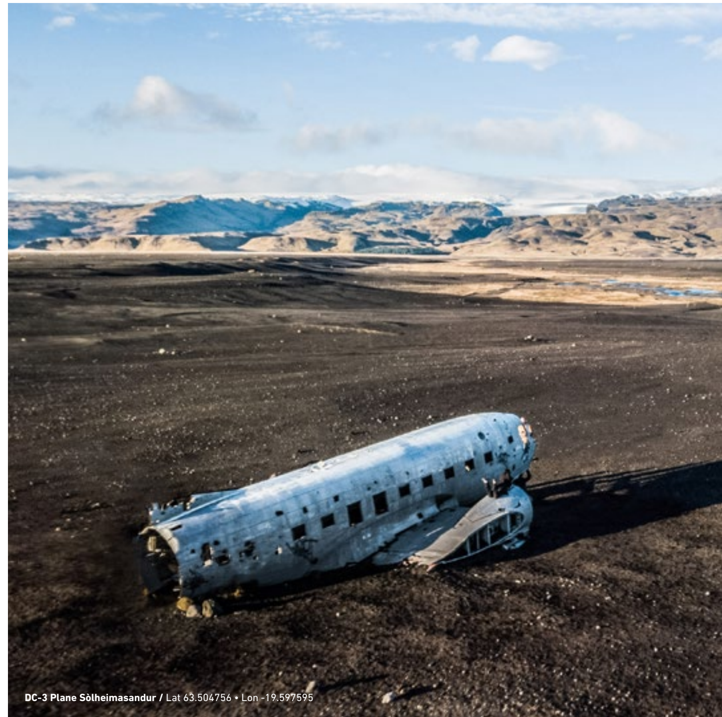
DC-3 Plane Sólheimasandur / Lat 63.504756 • Lon -19.597595