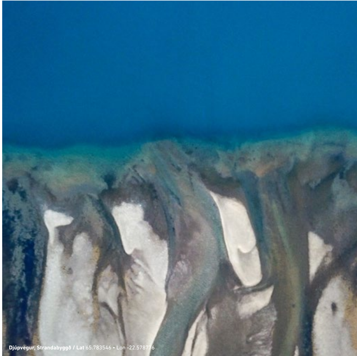
Djúpvegur, Strandabyggð • Lat 65.783546 • Lon -22.578776