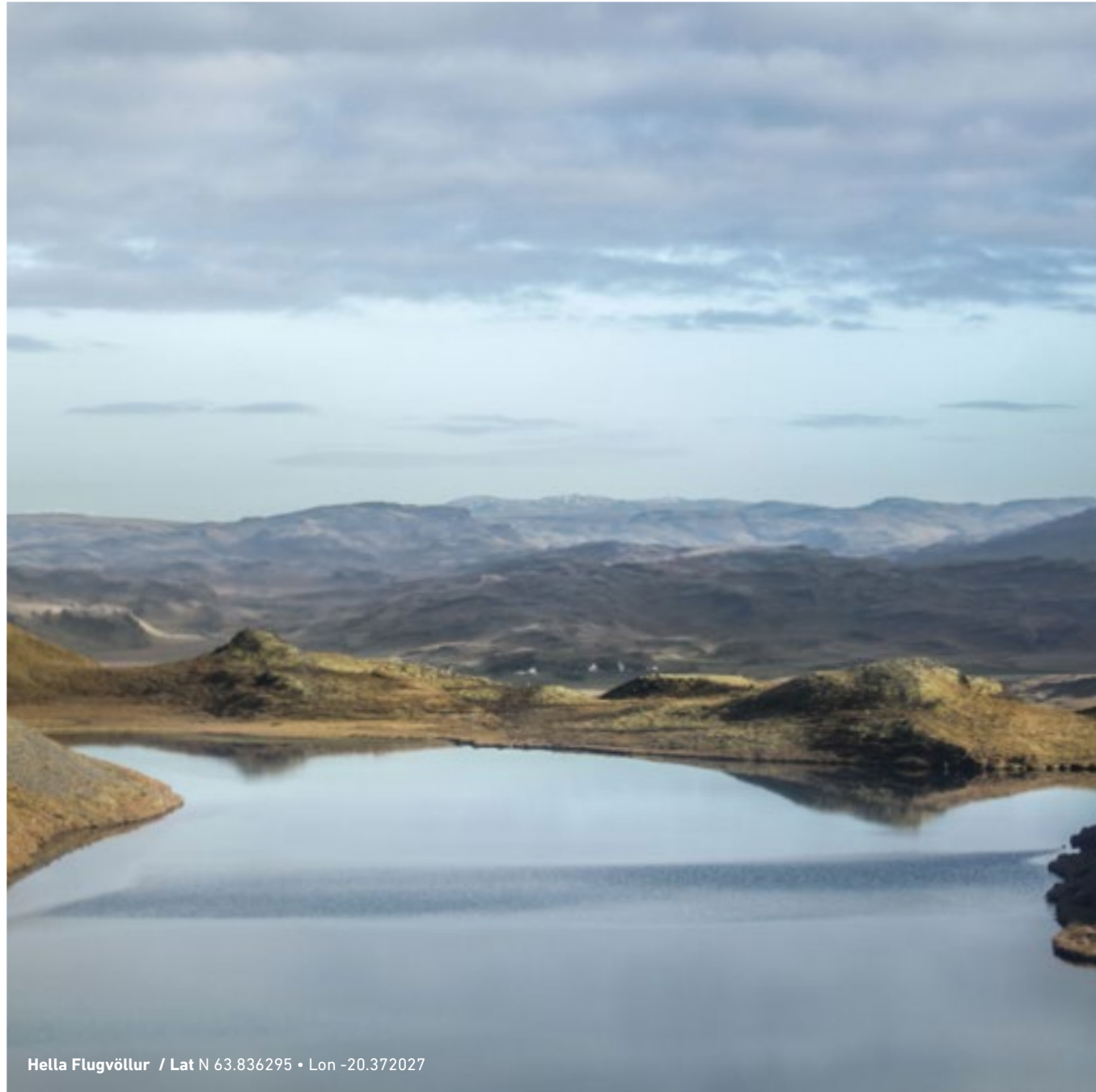
Hella Flugvöllur / Lat N 63.836295 • Lon -20.372027