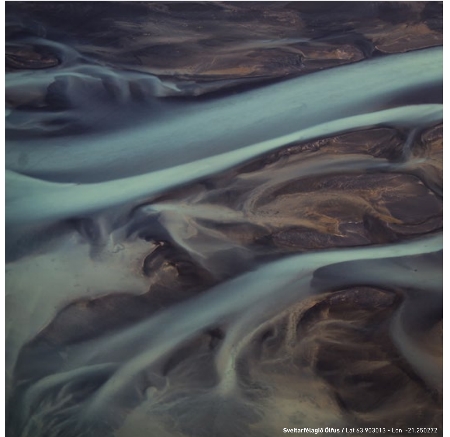
Sveitarfélagið Ölfus / Lat 63.903013 • Lon -21.250272