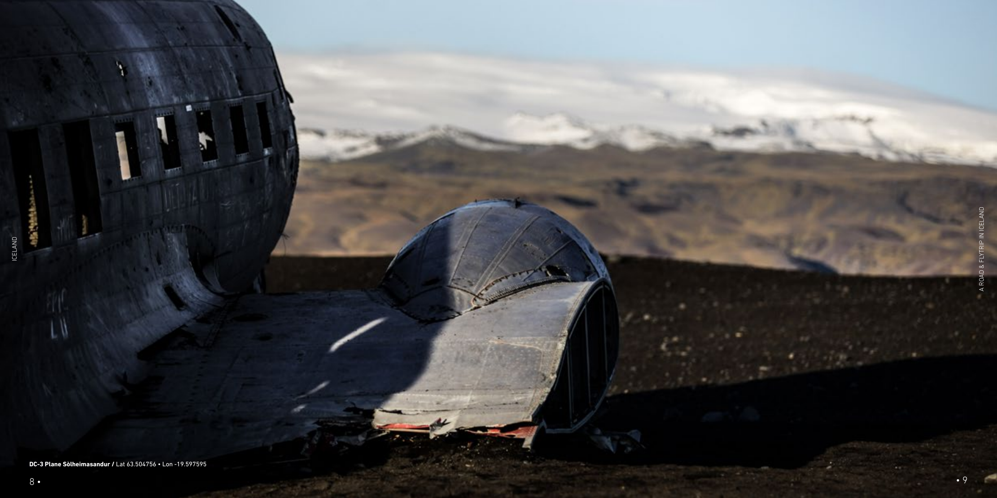
DC-3 Plane Sólheimasandur / Lat 63.504756 • Lon -19.597595