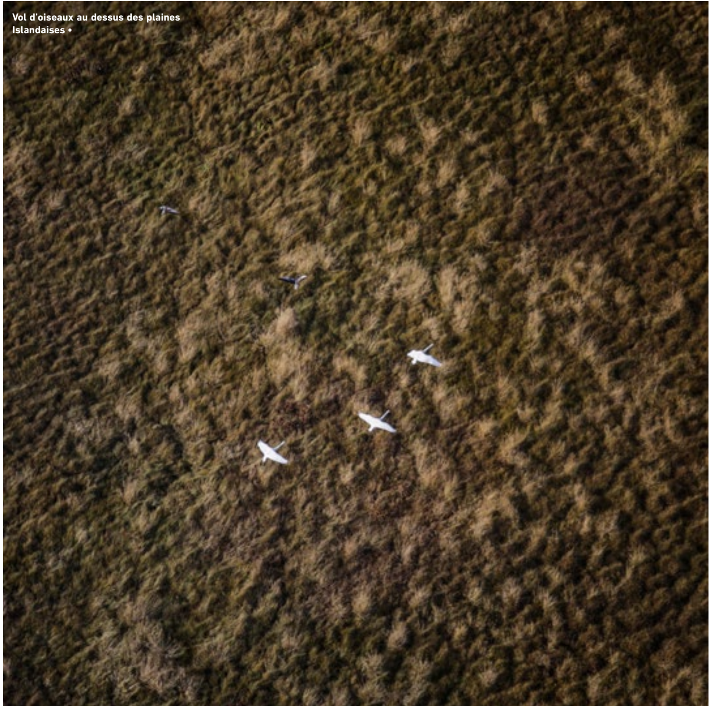
Vol d'oiseaux au dessus des plaines Islandaises •