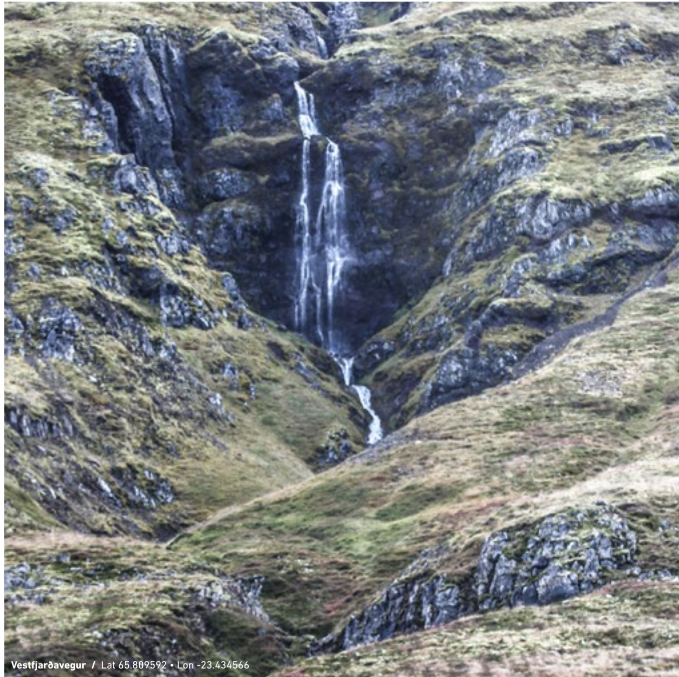
Vestfjarðavegur / Lat 65.809592 • Lon -23.434566