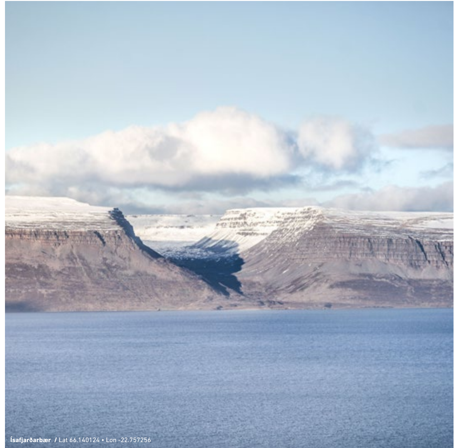
Ísafjarðarbær / Lat 66.140124 • Lon -22.757256