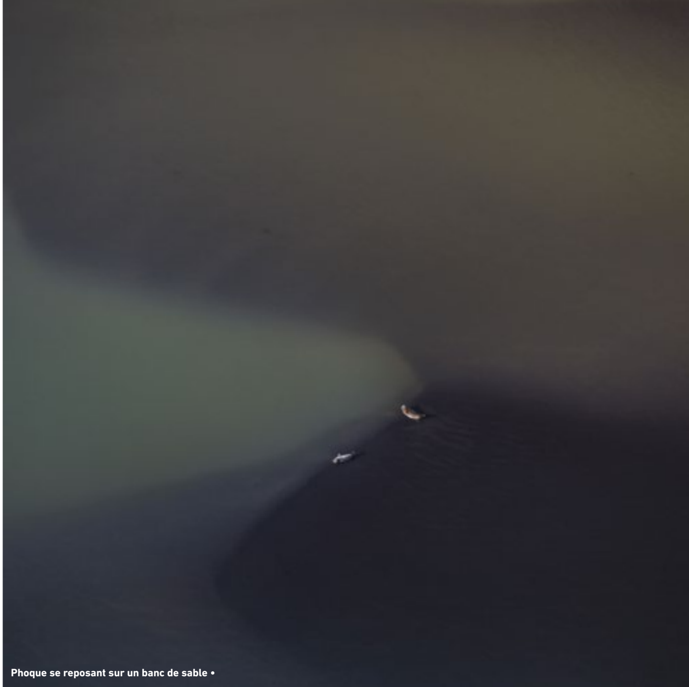
Phoque se reposant sur un banc de sable •