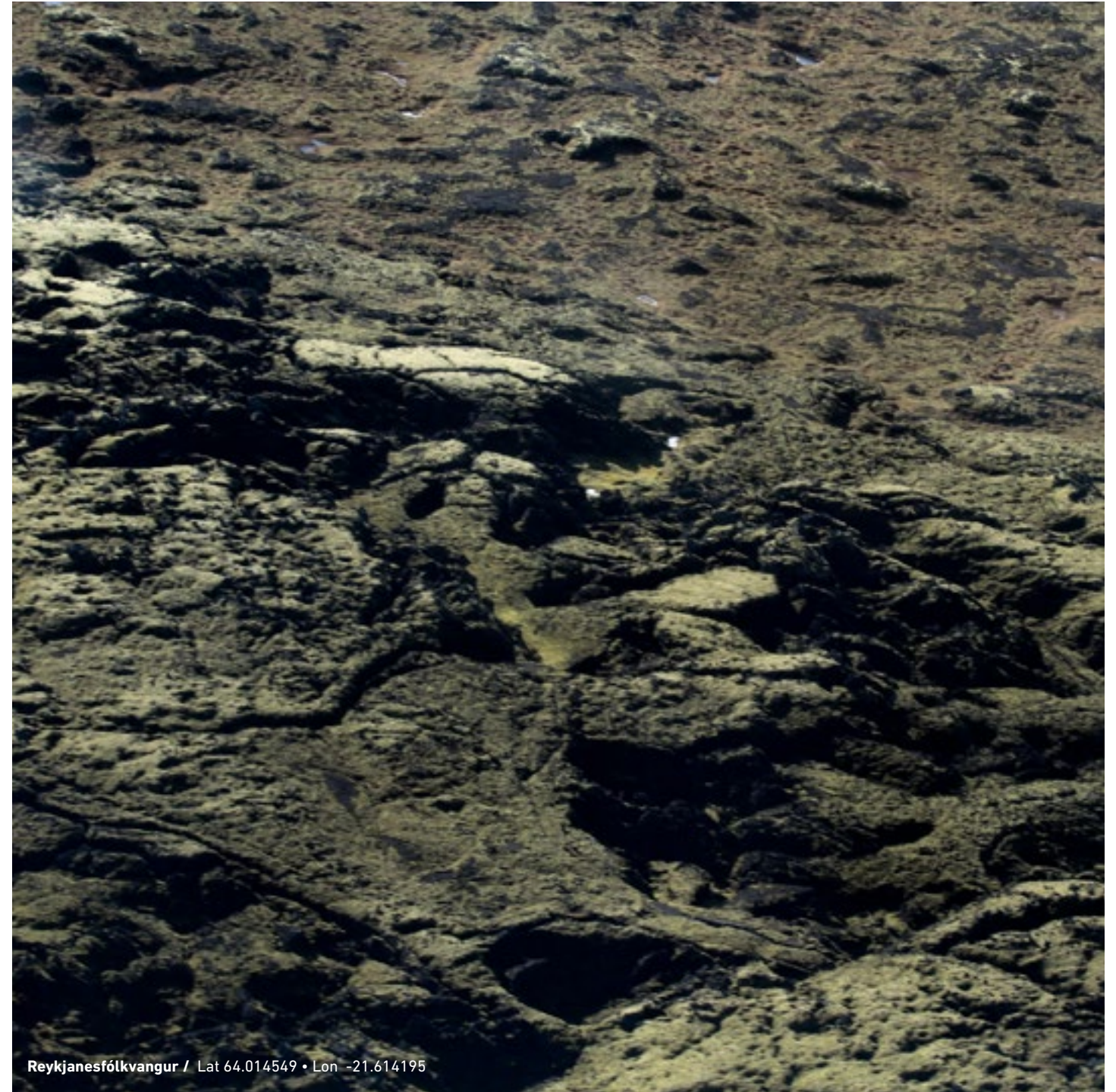
Reykjanesfólkvangur / Lat 64.014549 • Lon -21.614195