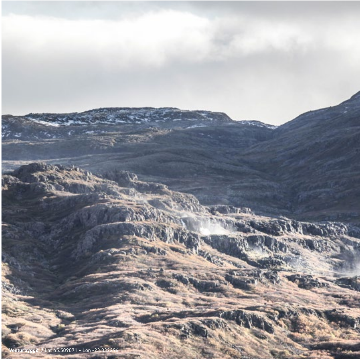
Vesturbyggð / Lat 65.509071 • Lon -23.832296

“Les âmes énergiques, comme les volcans , jettent de grandes lumières et de grandes ténèbres ”