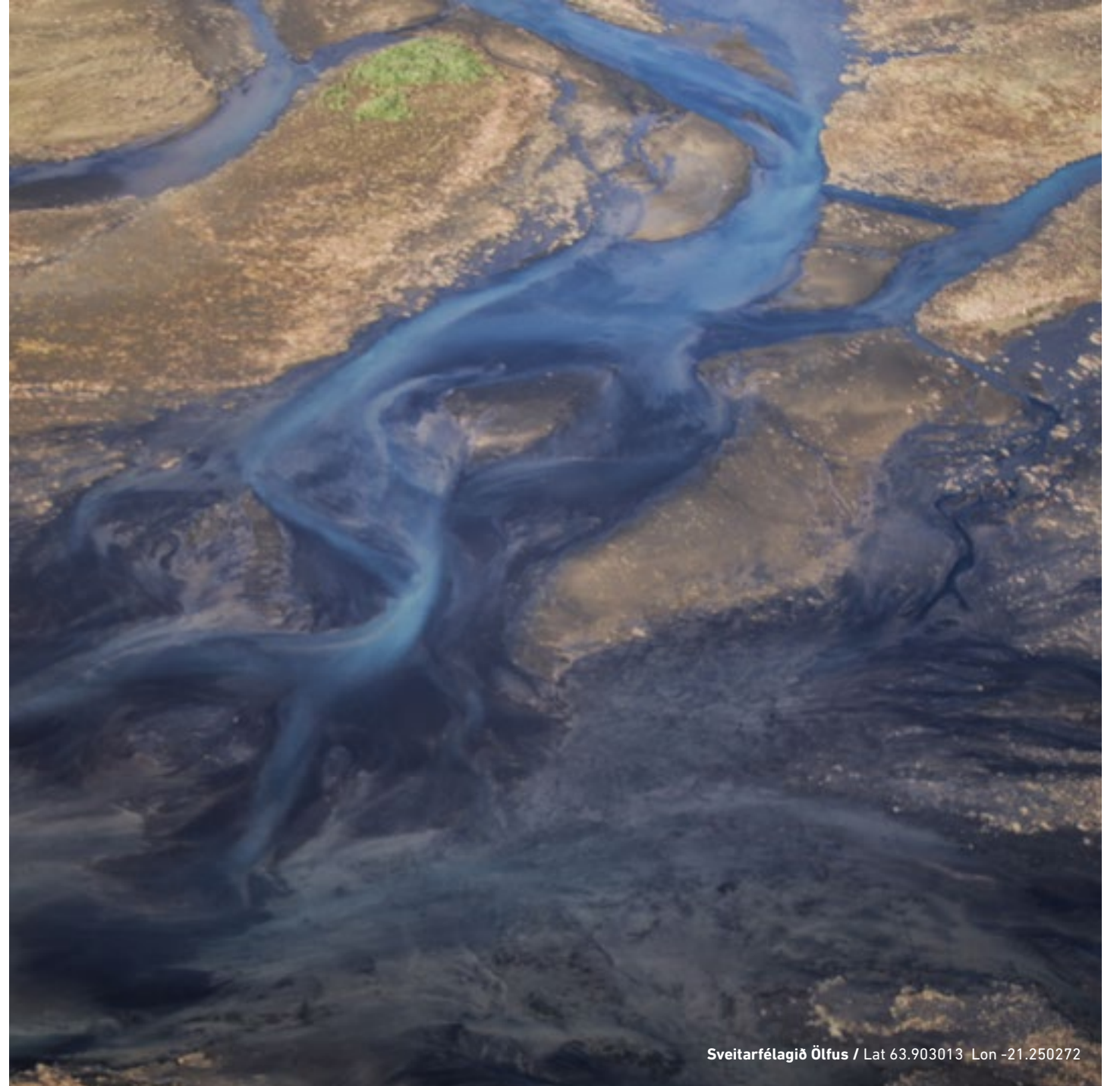
Sveitarfélagið Ölfus / Lat 63.903013 Lon -21.250272