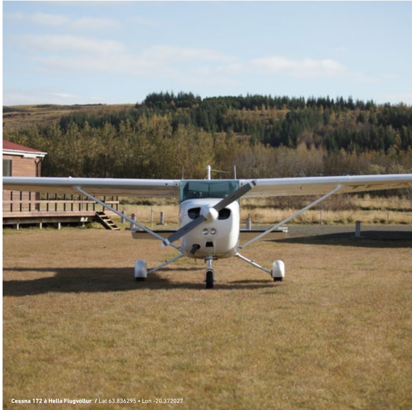
Cessna 172 à Hella Flugvöllur / Lat 63.836295 • Lon -20.372027

“Il n’y a pas d’homme plus complet que celui qui a beaucoup voyagé , qui a changé vingt fois la forme de sa pensée et de sa vie ”