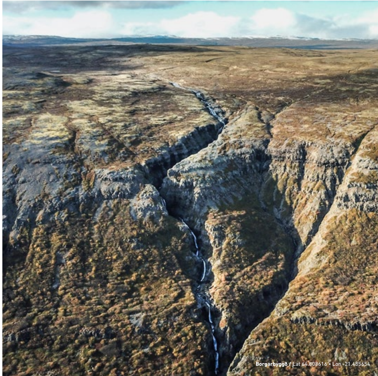
Borgarbyggð / Lat 64.808616 • Lon -21.485654

“La nature s’imite. Une graine jetée dans une bonne terre produit. Un principe jeté dans un bon esprit produit”