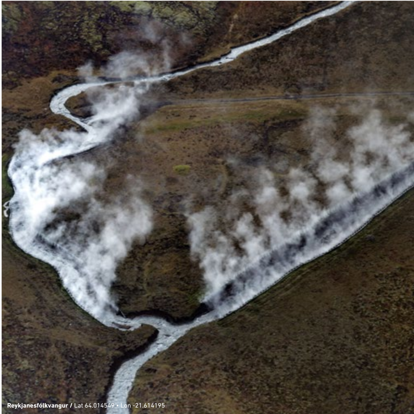
Reykjanesfólkvangur / Lat 64.014549 • Lon -21.614195