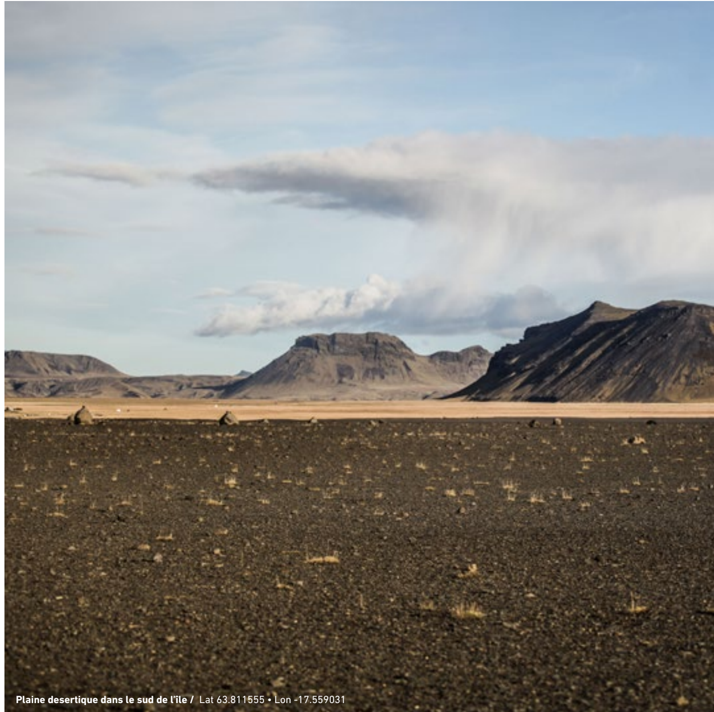
Plaine desertique dans le sud de l'île / Lat 63.811555 • Lon -17.559031

“Ce qui embellit le desert , dit le petit prince, c'est qu'il cache un puit quelque part”