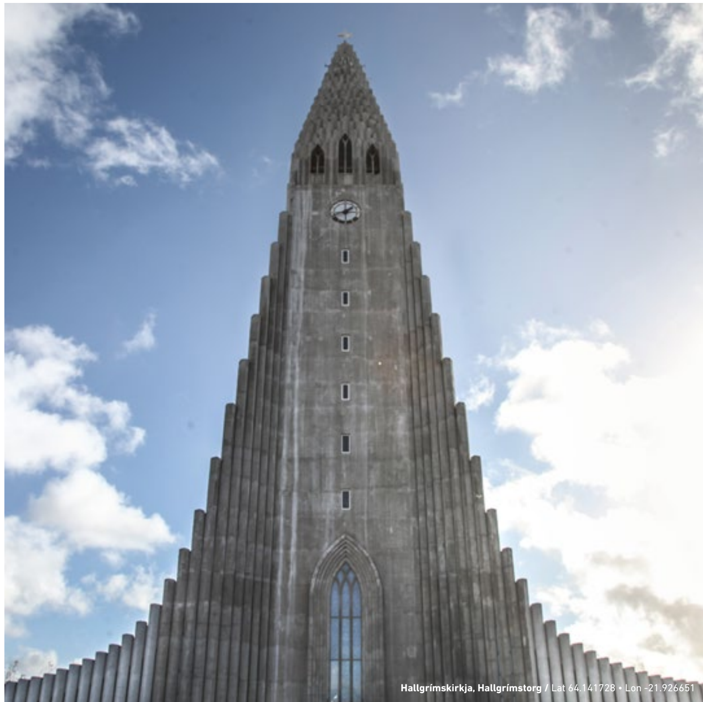
Hallgrímskirkja, Hallgrímstorg / Lat 64.141728 • Lon -21.926651

“ Toutes choses sont possible pour celui qui croit ”