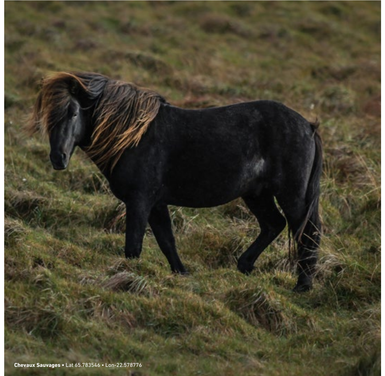
Chevaux Sauvages • Lat 65.783546 • Lon -22.578776