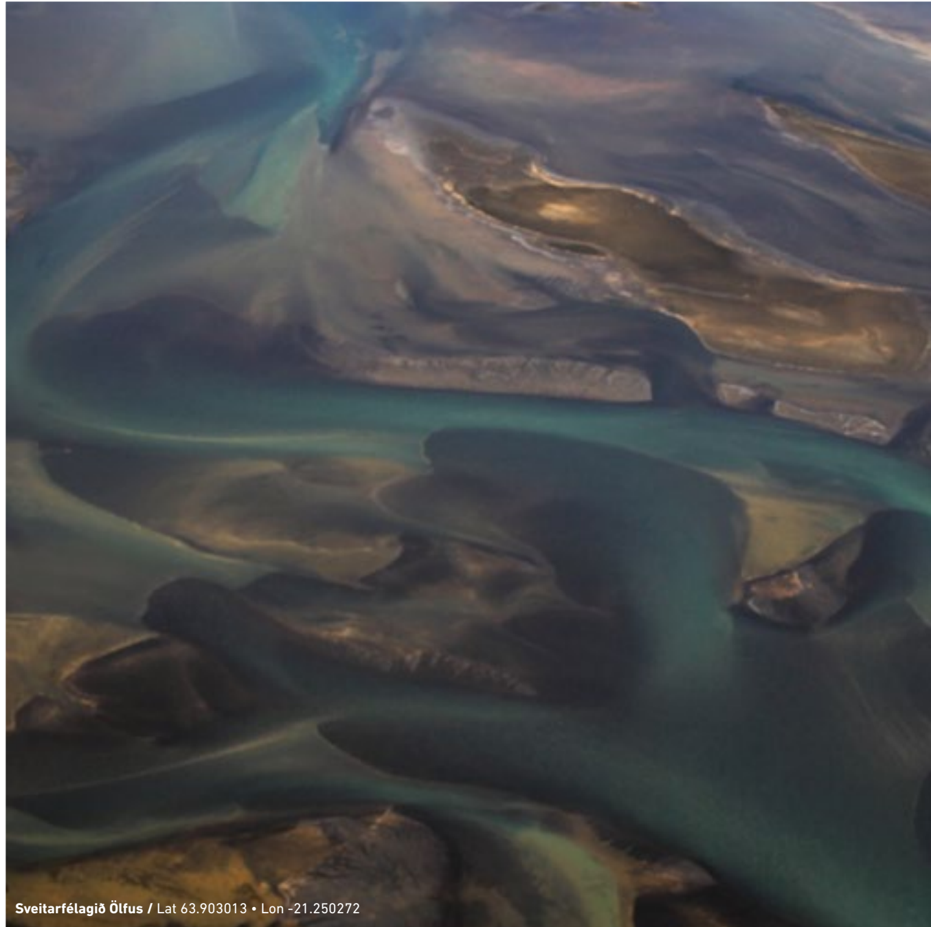
Sveitarfélagið Ölfus / Lat 63.903013 • Lon -21.250272