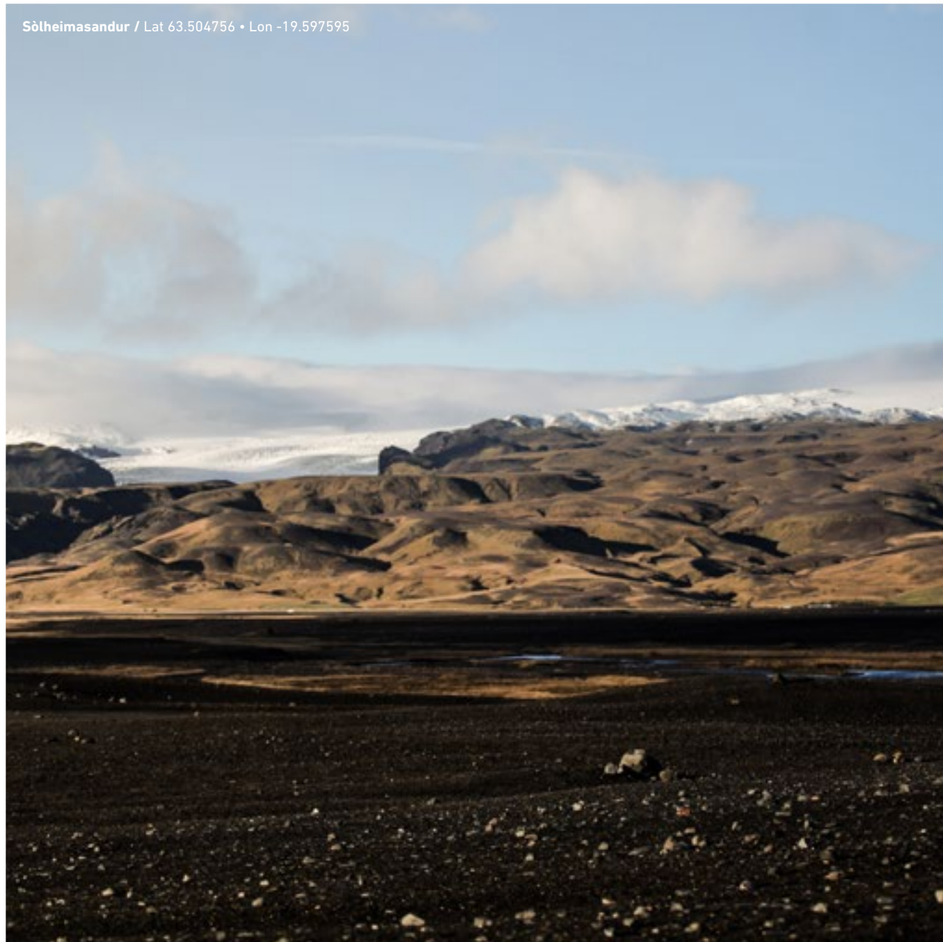
Sólheimasandur / Lat 63.504756 • Lon -19.597595