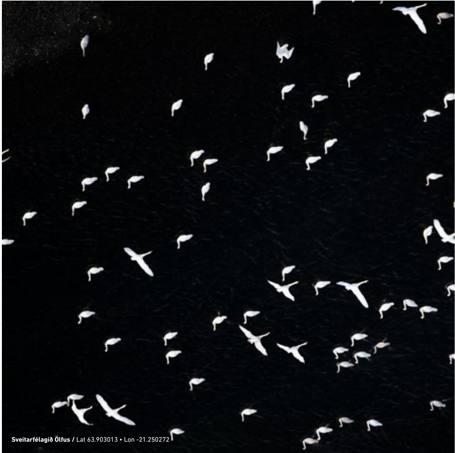
Sveitarfélagið Ölfus / Lat 63.903013 • Lon -21.250272